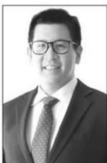
เอกนิติ นิติทัณฑ์ประภาศ

ที่สูงขึ้น และตลาดแรงงานที่อ่อนแรงลง ขณะที่การส่งออก และเม็ดเงินลงทุนจากต่างชาติ (FDI) ที่ขยายตัวสูงไม่ได้ ส่งผ่านสู่การขับเคลื่อนภาคเศรษฐกิจจริงและการจ้างงาน เทียบเท่ากับในอดีต สะท้อนจากอัตราการใช้กำลังการผลิตที่อยู่ใน ระดับต่ำ โดยเฉพาะในอุตสาหกรรมดั้งเดิม..ความจำเป็น ที่เราจะเห็นการปรับโครงสร้างเศรษฐกิจโลกยังมีต่อเนื่อง แม้ การรบจะไม่เกิด แต่การรบในรูปแบบเศรษฐกิจยังต่อเนื่อง เราเห็นการกีดกันทางการค้าในรูปแบบต่างๆ มากขึ้นและ ต่อเนื่อง...สำหรับสถานการณ์ SME ยังมีความท้าทายอยู่ ซึ่งเราไม่สามารถใช้ทักษะหรือรูปแบบการทำธุรกิจแบบเดิมๆ แล้วมุ่งหวังว่าจะได้กำไรแบบเดิมๆ ได้ เรื่องการ Up Skill เรื่อง การลงทุนภาคการผลิตต่างๆ เป็นสิ่งสำคัญมาก...!! แวดวงการเงิน ...เห็นว่านี่คือเสียงเตือนที่ทีมเศรษฐกิจของ “รัฐบาลหนู”... ที่นำโดย คุณเอกนิติ นิติทัณฑ์ประภาศ รองนายกรัฐมนตรี และรัฐมนตรีว่าการกระทรวงการคลัง...ต้องฟัง...และยึดมั่น ว่านี่ “เสียงกระดิ่งในใจ” ที่เตือนว่าต้องลงมือทำเรื่องพวกนี้ ได้แล้ว...เริ่มทำได้สักที...ซึ่งเอาเข้าจริงเรื่องที่คุณผยองบอก... ไม่ใช่เรื่องใหม่...เราพูดกันมาเป็น 10 ปี...ผ่านมา 5-6 รัฐบาล แต่ไม่มีรัฐบาลไหนลงมือทำ...ทุกรัฐบาลคิดเป็นอย่างเดียวกันคือ “กู้เงิน แจกเงิน”...และหาโครงการชี้หนุ้ชี้หมาอะไรก็ได้มาทำ เพื่อจะได้ “เงินทอน”...■ ■