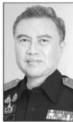
พรชัย จีระเวช

■■ ในเมื่อวันที่ 24-25 มิถุนายน 2569...ที่ผ่านมา คุณพรชัย จีระเวช อธิบดีกรมสรรพสามิต...ตระเวนลงพื้นที่ ตรวจเยี่ยมสำนักงานสรรพสามิตภาคที่ 1 และสำนักงานสรรพสามิตพื้นที่ใน 10 จังหวัดพื้นที่ภาคกลาง(ขยันแท้ 2 วัน 10 สำนักงาน)...เรื่องหลักที่อธิบดีกรมสรรพสามิต เน้นคือ...การเน้นย้ำให้สรรพสามิตทุก พื้นที่...เพิ่มความเข้มงวดในการเฝ้าระวัง สืบสวน และปราบปรามการลักลอบผลิต นำเข้า และจำหน่ายสินค้าเถื่อนกึ่งภาษี โดยเฉพาะ “บุหรีเดือน”...ซึ่งผลงานที่เป็นรูปธรรมในการลงพื้นที่ครั้งนี้คือในวันที่ 25 มิถุนายน ทีมของอธิบดีสรรพสามิต พร้อมสรรพสามิต พื้นที่พระนครศรีอยุธยา 1 และเจ้าหน้าที่สายตรวจฝ่ายปราบปราม...ได้เข้าตรวจสอบพัสดุต้องสงสัย ณ คลังกระจายสินค้าเอกชนแห่งหนึ่งในจังหวัดพระนครศรีอยุธยา....ผลการตรวจสอบพบการกระทำผิดตามพระราชบัญญัติ ภาษีสรรพสามิต พ.ศ. 2560 สามารถตรวจยึดบุหรีจิกา แรด ยี่ห้อกรองทิพย์ (FOR EXPORT ONLY) และบุหรี ต่างประเทศที่มีขอบด้วยกฎหมาย รวมจำนวนทั้งสิ้น 8,600 ของ ของกลางดังกล่าว มีมูลค่าประมาณ 574,769.88 บาท