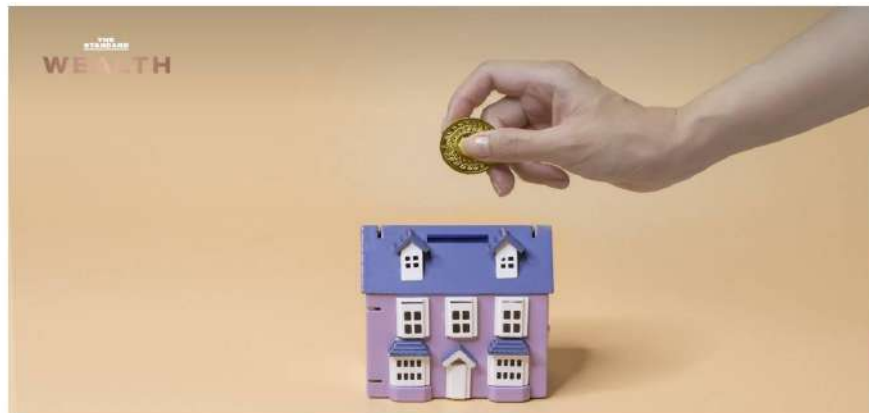
จินดา คลังจ่อชง ครม. ต่อยอายุมาตรการลดค่าโอน-จดจำนอง 0.01% อีก 1 ปี หวังพยุงอสังหาฯ-ลดภาระคนซื้อบ้าน

วันที่ (30 มิถุนายน) ดร.เมทินี ชโลธร อดีตนายกรัฐมนตรี รองนายกรัฐมนตรี และรัฐมนตรีว่าการกระทรวงการคลัง เผยว่า กระทรวงการคลัง เตรียมเสนอที่ประชุมคณะรัฐมนตรี (ครม.) ที่พิจารณาขยายมาตรการลดหย่อนภาษีเงินได้บุคคลธรรมดา โดยลดอัตราค่าธรรมเนียมการโอนกรรมสิทธิ์เหลือ 0.01% จากอัตราปกติ 2% และลดค่าจดจำนองเหลือ 0.01% จากอัตราปกติ 1% สำหรับที่อยู่อาศัยราคาไม่เกิน 7 ล้านบาท