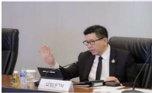
คลัง ชงครม. ต่ออายุค่าโอน-จดจำนอง

คลัง ชง ครม. ต่ออายุค่าโอน-จดจำนอง 0.01% อีก 1 ปี หวังช่วยลดภาระคนอยากมีบ้าน กระตุ้นภาคอสังหาฯ ให้ฟื้นตัว ยับแถมเลื่อนเศรษฐกิจไทยปีนี้อย่างช้าๆ