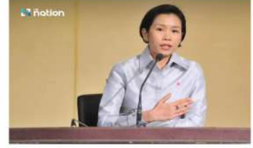
Government spokesperson Rattana Thanasitthakul

The Cabinet also approved two draft Interior Ministry amendments prepared by the Department of Lands. One covers registration fees under the Land Code for residential and commercial buildings, or land with such buildings. The other covers registration fees under condominium law for condominium units.