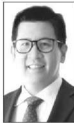
ดร.เอกนิติ นิติทัณฑ์ประภาศ

คิดเป็นภาษีสรรพสามิตประมาณ 555,048 บาท และประมาณการ ค่าปรับเป็นเงิน 8,325,686.10 บาท...ซึ่งการนี้เจ้าหน้าที่สรรพสามิตได้นำของกลางส่งพนักงานสอบสวน สถานีตำรวจภูธร วังน้อย เพื่อดำเนินคดีตามกฎหมายต่อไป...!! อธิบดีสรรพสามิต ประกาศกร้าว “กรมสรรพสามิตจะเดินหน้าบังคับใช้กฎหมายอย่างเข้มข้นและต่อเนื่อง เพื่อปราบปรามสินค้า ผิดกฎหมายทุกรูปแบบ โดยเฉพาะการลักลอบผลิต นำเข้า และจำหน่ายบุหรีเดือน ซึ่งส่งผลกระทบต่อระบบเศรษฐกิจ รายได้ของรัฐ และความเป็นธรรมทางการค้า พร้อมปกป้องผลประโยชน์ของประเทศอย่างเต็มกำลัง และผมจะเป็น แม่ทัพใหญ่ในการปราบบุหรีเดือนด้วยตัวเอง”...!! เอ้อ เอ้อ... ท่านอธิบดีเคยได้ยินคำนี้ไหมครับ “ขยันผิดที่ไม่มีวันรวย”... ก็เหมือน “บุหรีเดือน” นั้นแหละ...ที่จับได้ก็แค่ “ยอดภูเขา น้ำแข็ง”...ของจริงมีเยอะกว่านั้น ไล่จับยังก็ไม่หมดคนทำผิด ที่จับได้ก็ปลาจิ่วปลาสร้อย...ตัวเผิง...ตัวพอ...ที่เป็นตัวการใหญ่.. ยังไงก็เข้าไม่ถึง...ที่สำคัญด้วยส่วนต่างราคาระหว่าง “บุหรี ถูกกฎหมาย” กับ “บุหรีเดือน”...มันคุ้มที่จะเสี่ยง...หักจ่ายเบี้ย บ้ายรายทางไปแล้ว...ยังเหลือกำไรอีก...!! ท่านอธิบดีก็น่า จะทราบดีว่าต้นทุนของมัน “โครงสร้างภาษี 2 อัตรา”...ที่ ทำให้ส่วนต่างราคามันสูง...เชื่อก...แวดวงการเงิน...เออะครับ... ท่านไปอ้อนวนอน...ดร.เอกนิติ นิติทัณฑ์ประภาศ รองนายกรัฐมนตรีและรมว.คลัง...รับเอาเรื่อง “ภาษีบุหรีอัตราเดียว” (ที่ท่านอธิบดีทำเสร็จแล้ว) เข้าที่ประชุมคณะรัฐมนตรีเสียที เออะ...อันนั้นช่วยสรรพสามิตได้เยอะเลย...!! อย่ามัวกลัวๆ กลัวๆ อยู่เลย...■■■