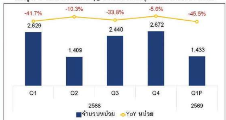
แผนภูมิที่ 1 จำนวนหน่วยที่ได้รับใบอนุญาตจัดสรรที่ดินเพื่อที่อยู่อาศัยใน EEC ไตรมาส 1 ปี 2569