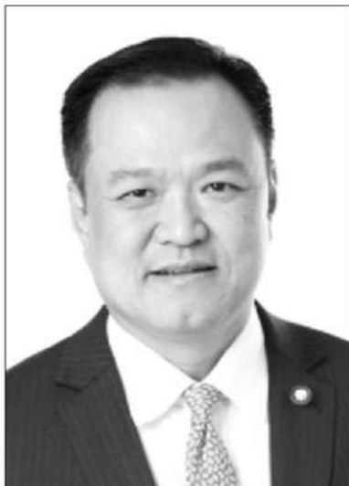
อนุทิน ชาญวีรกูล

ย่อยเพื่อขับเคลื่อนใน 4 ด้านหลักๆ ได้แก่ ด้านการพัฒนาการลงทุนใหม่ของประเทศ, ด้านการพัฒนาการค้า การท่องเที่ยว และเศรษฐกิจชุมชน, ด้านการยกระดับทรัพยากรมนุษย์และการพัฒนาเทคโนโลยี และด้านการพัฒนาการอำนวยความสะดวก