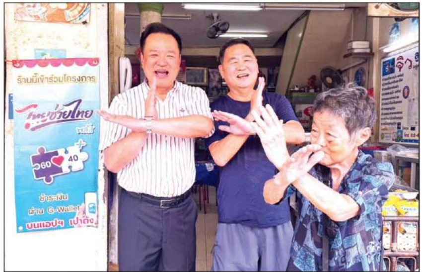
▲ ไทยช่วยไทยพลัส : นายอนุทิน ชาญวีรกูล นายกรัฐมนตรีและรมว.มหาดไทย ทำท่าพลัสร่วมกับเจ้าของร้านที่เข้าร่วมโครงการไทยช่วยไทยพลัส 60/40 อย่างอารมณ์ดี ในระหว่างลงพื้นที่ย่านศรียาน เขตดุสิต กทม. เพื่อพบปะประชาชนที่มาจับจ่ายใช้สอย ในโครงการดังกล่าว โดยมีประชาชนเข้ามาขอถ่ายภาพร่วมกันอย่างเนืองแน่น

พนักงาน ลูกจ้าง หรือเจ้าหน้าที่ของหน่วยงานของรัฐที่มีรายได้เกิน 100,000 บาทต่อปี ผู้รับบำนาญ เบี้ยหวัด หรือบำนาญรายเดือนจากภาครัฐ ผู้ถือหุ้น กรรมการบริษัท หรือหุ้นส่วนในห้างหุ้นส่วน ผู้มีบัญชีซื้อขายหลักทรัพย์หรือถือครองตราสารหนี้ ผู้มีกรรมกรรมประกันชีวิตประเภทสามัญและชำระเบี้ยประกันตั้งแต่ 12,000 บาทต่อปีขึ้นไป ผู้ที่ถูกนำชื่อไปใช้สิทธิลดหย่อนในการคำนวณภาษีเงินได้ในฐานะบิดา มารดา คู่สมรส หรือบุตร