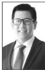
เอกนิตินิติศัพท์ประกาศ

เพราะเม็ดเงินไหลเข้าสู่ “ธุรกิจระดับรากหญ้า” โดยตรง... และเอาเข้าจริง... ห้างค้าปลีกขนาดใหญ่ก็ไม่ได้ถูกตัดออกจากวงจรของการไหลของเม็ดเงินก้อนนี้ (ประมาณ 2 แสนล้านบาท)... เพราะร้านค้าขนาดเล็ก ร้านขายอาหารรถเข็น ร้านข้าวแกง ร้านก๋วยเตี๋ยว (ระดับห้องแถว) ร้านหมูปิ้ง รดเงิน ฯลฯ สุดท้ายก็ต้องเข้าซื้อสินค้า ซื้อวัตถุดิบ จากห้างค้าปลีกค้าส่งขนาดใหญ่มาขายต่ออยู่ดี...!! แล้วว่าวันที่ 10 มิถุนายนนี้... ตัวแทนจากสภาหอการค้าไทยจะเข้าพบและหารือ