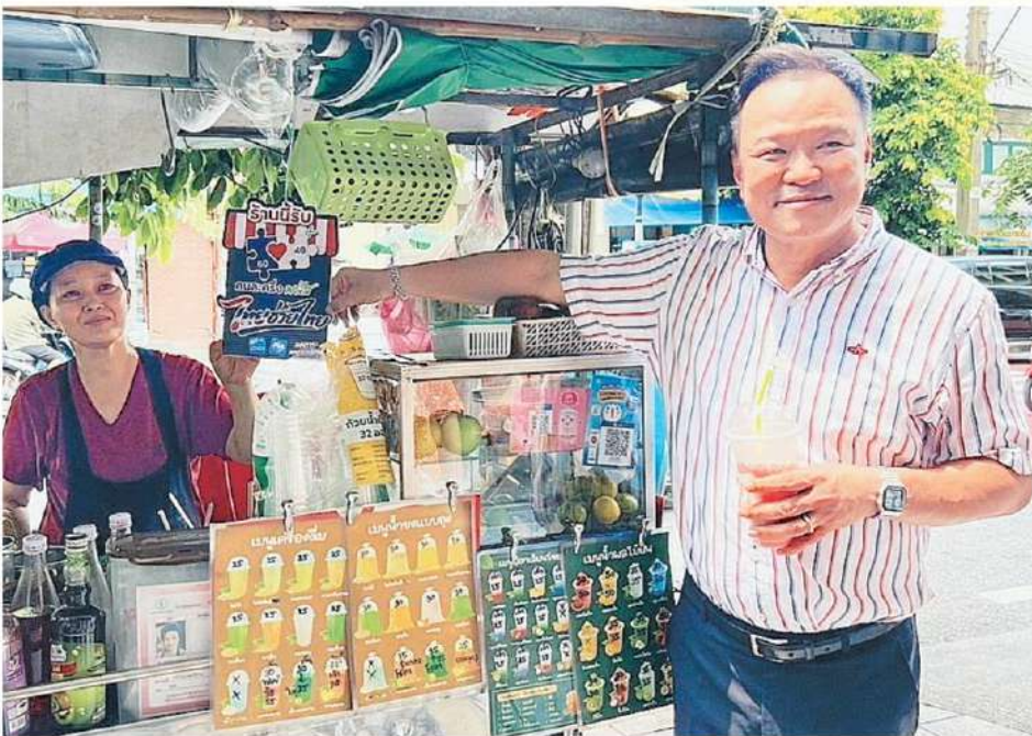
▲ กระแสดี นายอนุทิน ชาญวีรกูล นายกฯ และ รมว.มหาดไทย ชื่อ “นมชมพู” จากร้านกาแฟในตลาดศรีریان ขณะลงพื้นที่ติดตามการจับจ่ายใช้สอยในโครงการไทยช่วยไทย พลัส ระบุกระแสตอบรับดีคึกคัก.

นายเอกนิติ นิติทัณฑ์ประภาศ รองนายกฯและ รมว.คลัง กล่าวถึงหลักเกณฑ์การคัดกรองผู้