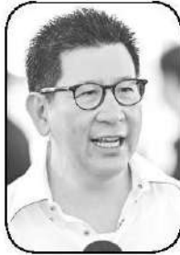
เอกนิติ นิติทัณฑ์ประภาศ

ของจริง เจ้าตัวก็ยอมรับว่ากระแสดี ซึ่งไม่น่าแปลกใจแต่ประการใด เพราะชาวบ้านเฝ้ารอเรื่องนี้นานแล้ว ...● โดยตัวเลขล่าสุดที่กระทรวงการคลังแจกออกมา ข้อมูล ณ วันที่ 3 มิ.ย. เวลา 13.00 น. พบว่ามีประชาชนเข้าร่วมโครงการแล้ว 26,040,823 คน และมีประชาชนนำสิทธิไปใช้จ่ายจนเสร็จสมบูรณ์แล้วจำนวน 15,631,367 คน ขณะที่ฝั่งร้านค้า ยอดรวมของร้านค้าที่ลงทะเบียนเสร็จสิ้นและกดสิทธิ์ยอมรับเงื่อนไขแล้ว 946,465 ร้านค้า โดยมียอดใช้จ่ายรวมสะสม 3 วัน อยู่ที่ 5,519.54 ล้านบาทแล้ว ...● ในขณะที่ “ไทยช่วยไทยพลัส” กำลังขึ้นหม้อ แต่ดูเหมือน “บัตรสวัสดิการแห่งรัฐ” ที่ “เอกนิติ นิติทัณฑ์ประภาศ” รองนายกฯ และ รมว.การคลัง ซึ่งเพิ่งทำคลอดออกมาจากมติคณะรัฐมนตรีเมื่อวันอังคารที่ 2 มิ.ย. จะถูกบ่นและโวยเสียมากกว่า โดยต่างระบุไปในทางเดียวกันว่าหลักเกณฑ์เข้มงวด และเรียกร้องให้ปรับปรุง แต่หากดูด้วยใจเป็นธรรมแล้วก็ต้องบอกว่าการกระทรวงการคลังทำถูกต้องที่จะดูแลและคัดกรองผู้ที่เดือดร้อน