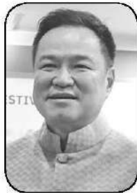
อนุทิน ชาญวีรกุล

นพฤษที่ 3 มิถุนายน พุทธศักราช 2569 ถือเป็นวันมหามงคลอย่างยิ่ง เนื่องในโอกาสพระราชพิธีมหามงคลเฉลิมพระชนมพรรษา 4 รอบ “สมเด็จพระนางเจ้าสุทิดา พัชรสุธาพิมลลักษณ พระบรมราชินี” ซึ่งในการนี้สมเด็จพระอริยวงศาคตญาณ (อมฺพรมหาเถร) สมเด็จพระสังฆราช สกลมหาสังฆปริณายก มีพระดำรัสถวายพระพรตอนหนึ่งว่า “ณ มงคลวาระที่ทรงเจริญพระชนมายุบรรลุนิติ 4 รอบพระนักษัตร จึงขอ