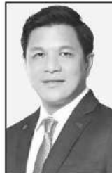
วิทย์ รัตนากร

กับ คุณอนุทิน ชาญวีรกูล นายกรัฐมนตรี...ไม่รู้ว่าจะมีการร้องขอประเด็นนี้กับนายกฯหรือเปล่า...เดี๋ยวมาจับตาดูกันต่อว่าหากมีการร้องขอจริงนายกฯจะใจอ่อนไหม... ■ ■ เอาล่ะสิ... เมื่อ คุณวิทย์ รัตนากร ผู้ว่าการธนาคารแห่งประเทศไทย (ธปท.)...สวมบท “คุณชายละเอียด” ลงมาโฟกัสในการปัญหา “หนี้” ของภาคประชาชน... โดยเล็งเป้าไปที่ธุรกิจ Buy Now Pay Later (BNPL) หรือ “ซื้อก่อนจ่ายทีหลัง”... ก็อาจจะถูกผู้บริหารบริการทางการเงินทั้ง BANK และ Non-Bank... ออกอาการเห่ๆ หรือบางรายอาจมองค้อนด้วยสายดาเขียวบ้าง...!! แต่งานนี้... แนววงการเงิน... ยืนข้างท่านผู้ว่าการแบงก์ชาติครับ... เพราะเชื่อว่าท่านคงมองเห็นว่าถ้าปล่อยไปปัญหาจะบานปลายเป็นปัญหาใหญ่จนยากจะแก้ไขได้... และทั้งนี้ทั้งนั้นสิ่งที่ท่านผู้ว่าการแบงก์ชาติกำลังดำเนินการ... ก็ไม่ใช่การปิดกั้นเข้าถึงเงินทุนในระบบสำหรับประชาชนที่ต้องการสภาพคล่องเพื่อใช้ในยามจำเป็นของชีวิตหรือของผู้ประกอบการที่ต้องการเงินทุนเพื่อลงทุนหรือทำให้ธุรกิจเดินต่อได้... แต่สิ่งที่แบงก์ชาติกำลังจะดำเนินการคือการสกัดกั้นการ “ก่อหนี้ที่เกิดจากความจำเป็นของชีวิต”... ซ้ำกลุ่มผู้ก่อหนี้ก็เป็นคนจน Z... ทั้งนักศึกษา... First Jobber...!! ถ้าเราปล่อยให้คนรุ่นนี้เริ่มต้นชีวิตด้วยการเป็นหนี้... บวกกับหนี้ครัวเรือนของคนรุ่นก่อน... สิ่งที่จะเกิดขึ้นไม่ใช่แค่เรื่อง “ความมั่นคงทางเศรษฐกิจ” แต่มันจะมีความเสี่ยงกับ “ความมั่นคงทางสังคม” ด้วย... ซึ่งตอนนี้มันก็ไม่ได้ดีอยู่แล้ว... ■ ■