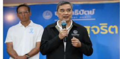
On the formation of government plans, the Democrat Party said the loan decree is economically unstable and worsening risks. For example, using 200 billion baht for a 100-day loan, usually within four months terms payments. If the budget is exhausted but some assets, such as energy-related assets, which the government would have to spend on debt, increasing national debt, increasing the risk of defaulting on the loan.

He explained that just because others borrowed doesn't mean the situation is identical. He said the strategy of loan seeking to remedy or support that are aimed not under the same measures and circumstances. Regarding the deputy prime minister's statement about the government's direction under the constitution, he stressed that the government must exercise this direction honestly and transparently, supporting the direction if obtained the opposition is prepared to negotiate and accept constitutional resolutions.