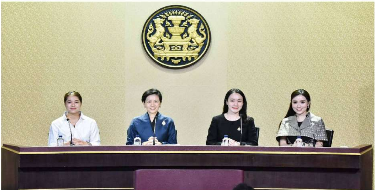
The Cabinet resolution divides responsibilities among seven agencies to manage deals for the 2026 World Cup. The Ministry of Finance is ordered to grant tax exemptions, and coordination with Thaicom is planned to link live broadcast signals across Thailand.

On 13 May 2026, following the Cabinet's resolution to broadcast the 2026 World Cup, scheduled from 11 June to 19 July 2026, the government instructed seven main agencies to coordinate comprehensively to prepare for live signal transmission from the United States, Canada, and Mexico, ensuring timely and lawful compliance with international copyright.