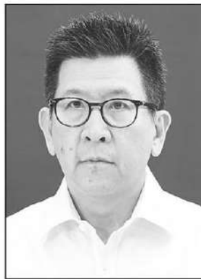
เอกนิติ นิตินันท์ประภาศ

การปฏิรูป (Transform), ความโปร่งใส (Transparency) และการมีส่วนร่วม (Together) จะเป็นเครื่องมือสำคัญที่ช่วยทำให้เกิด "การเปลี่ยนผ่านด้านการลงทุน" รองนายกรัฐมนตรีและ รว.การคลังระบุ.