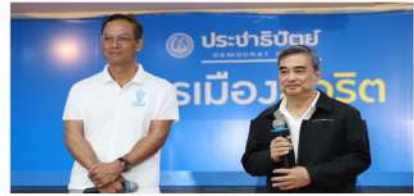
Abhisit warned leaders to government that issuing a 400 billion baht loan decree risks engulfing the nation. He urged the swift passage of a budget transfer law to address issues more comprehensively. Korn of Democrat Party criticized refinery profits and urged windfall tax.

AT 10:30 A.M. ON 13 MAY 2026, THE ABHISIT VEGIAPAI party (DP) and leader of the Democrat Party, held a press conference at the Democrat Party office, and criticized the government regarding the rushed issuance of a loan decree for 400 billion baht to address the energy crisis and stabilize the situation in early 2026. The Democrat Party expressed its opposition to the loan decree, believing that the loan would worsen the public debt.