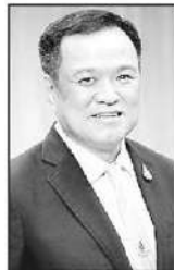
อนุทิน ชาวยิวรุก

ที่แจกให้กลุ่มเปราะบางคนละ 1 หมื่นบาท... และมาถึงยุคของรัฐบาล “หนู 1” (อนุทิน ชาวยิวรุก)... ก็แจกผ่าน “คนละครึ่ง พลัส”... จนมาถึงยุคนี้ “หนู 2”... ก็แจกอีก... เดิมตั้งใจจะผ่าน “คนละครึ่ง พลัส” ภาคสอง... แต่พอเกิดวิกฤตพลังงานรอบนี้... ก็เลยเปลี่ยนชื่อเป็น “ไทยช่วยไทย”... ได้คนละ 4 พันบาท.. ประมาณ 30 ล้านคน... วงเงินที่ตั้งไว้ก็ประมาณ 2 แสนล้านบาท... ผ่านมากกว่า 10 ปี 4 รัฐบาล... ไม่เคยเห็นรัฐบาลไหนทำให้คนไทยมีรายได้เพิ่มขึ้นเลยแม้แต่รัฐบาลเดียว... ก่อนจะมาเป็นรัฐบาล “หนู 2”... คุณอนุทิน... ก็ประกาศบนเวทีหาเสียงว่า... จะทำให้คนไทยรายจกร่องขอชีวิต ต้องร้องว่าพอแล้ว พอแล้ว รวยไม่ไหวแล้ว...!! “ไหนครับท่านนายก... บอกมาหน่อยว่าจะทำอย่างไร... บอกวิธีที่แสดงความฉลาดของรัฐบาล... ที่จะทำให้คนไทยรวยขึ้นจนต้องร้องขอชีวิตมาหน่อย... เอาเข้าจริงคุณอนุทินก็ร่วมบริหารประเทศมาตั้งแต่ยุครัฐบาลลุงตู่แล้วนะ... ร่วมรัฐบาลมาตลอด (จะเว้นวรรคไม่กี่เดือนในช่วงปลายรัฐบาลแพทองธาร)... มาวันนี้เป็นรัฐบาลที่มีอำนาจเต็มในมือ... ไม่จำเป็นต้องรอเวลาที่จะโชว์ความฉลาดที่จะทำให้คนไทยรวยขึ้น... ก็ไหนบอกกว่า “สั่งวันนี้ต้องเสร็จตั้งแต่เมื่อวาน” ใจครับท่าน... นายกฯ หนู...!! เอ๊ะ... หรือว่าถ้าประชาชนป้อนปากตะโกนว่า... รักษาดี รักษาดี... แล้วจะรวยขึ้นรวยขึ้น... เหมือนบริษัทน้ำมันของญาติรองนายกฯ ในรัฐบาลท่าน... ■ ■