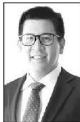
เอกนิติ นิติทัณฑ์ประภาศ

■ ■ น่าจะเป็นครั้งที่ร้อยแล้วมั้งที่... คุณเอกนิติ นิติทัณฑ์ประภาศ รองนายกรัฐมนตรีและรัฐมนตรีว่าการกระทรวงการคลัง... ออกมาย้ำกับสังคมว่ารัฐบาลมีความจำเป็นที่ต้องออกพระราชกำหนดกู้เงิน 4 แสนล้านบาท... เพราะมันเป็นเรื่องความมั่นคงทางเศรษฐกิจและวิกฤตปากท้องประชาชน... ส่วนที่หลายคนนำไปเปรียบเทียบกับเหตุการณ์ในอดีต เช่น ในปี 2540 ครั้งนั้นต้องเรียกว่าวิกฤตค่าเงิน และวิกฤตแบงก์ล้ม... ซึ่งแตกต่างจากในขณะนี้ที่เป็นวิกฤตค่าครองชีพ...!! คืออย่างนี้ครับท่านรมว.คลัง... เรื่องปัญหาค่าครองชีพของคนไทยเนี่ยนะ... มันมีมาก่อนที่จะเกิด” สงครามตะวันออกกลางจนก่อให้เกิดวิกฤตราคาพลังงาน” อีกนะครับ ดูได้จากกำลังซื้อภาคครัวเรือนที่หดตัวมาต่อเนื่องหลายปีแล้ว... สิ่ง que รัฐบาลทำมาตลอดกว่า 10 ปี คือกู้เงินมาแจกประชาชน... ไ้มาตั้งแต่สมัยรัฐบาลของ พลเอกประยุทธ์ จันทร์โอชา... ที่ก่อกำเนิด “บัตรคนจน” (บัตรสวัสดิการแห่งรัฐ)... แจกเงินผ่านโครงการคนละครึ่ง... จนมาถึงรัฐบาล คุณเศรษฐา ทวีสิน และยุคของแพทองธาร ชินวัตร... ที่แปลงร่างจาก “เงินดิจิทัล” มาเป็นเงินสด