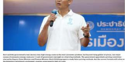
Korn said the government's loan decree risks high energy costs to the public, worsens the public hardship, and worsens public hardship, demanding a windfall tax.

3. The government should consider a windfall tax on refinery profits to address the energy crisis and stabilize the situation. He said the government should consider a windfall tax on refinery profits to address the energy crisis and stabilize the situation.