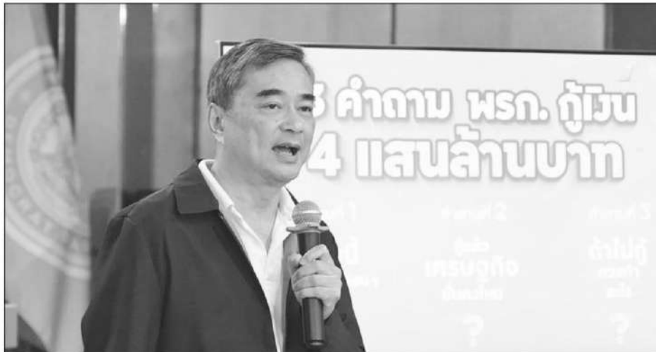
นายอภิสิทธิ์ เวชชาชีวะ หัวหน้าพรรคประชาธิปัตย์ แถลงถึงปัญหากรณีรัฐบาลออกพระราชกำหนดให้อำนาจกระทรวงการคลังกู้เงิน เพื่อแก้ปัญหาผลกระทบจากสถานการณ์วิกฤตด้านพลังงานและสร้างการเปลี่ยนผ่านด้านพลังงานของประเทศ พ.ศ. 2569 วงเงิน 4 แสนล้านบาท