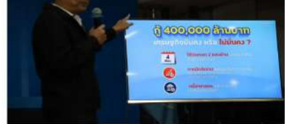
They urged the government to expedite passing the budget transfer law as a better solution.

4. Issuing a budget transfer law is necessary to address the energy crisis, but it must be accompanied by other measures, such as a windfall tax on energy-related assets, to ensure that the government can manage the energy crisis effectively.