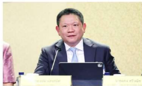
นายอรรถพล แสงสนิท

ขณะที่นายอรรถพล แสงสนิท ปลัดกระทรวงการคลัง กล่าวว่า ความคืบหน้าโครงการรถเก่าแลกรถใหม่ ขณะนี้สรรพสามิตอยู่ระหว่างจัดทำรายละเอียดของโครงการ และยึดถือหลักการหลายประเด็น โดยเฉพาะเรื่องการประเมินราคาคร่าวๆ ซึ่งทำได้ยาก เนื่องจากรถแต่ละคันมีสภาพ และมูลค่าแตกต่างกัน หากคำนวณคร่าวๆ อาจ 50,000-60,000 บาท อาจก่อให้เกิดปัญหาได้ทั้งกรณีผู้รับแลกไม่ผ่านหรือรถเก่า หรือสูงเกินไปสำหรับรถที่มีมูลค่าน้อย