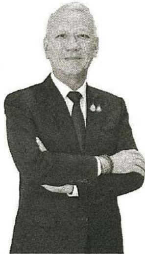
พีพัฒนา รัชกิจประการ

นายพีพัฒนา รัชกิจประการ รองนายกรัฐมนตรีและรัฐมนตรีว่าการกระทรวงคมนาคมเปิดเผยความคืบหน้าโครงการก่อสร้างสะพานข้ามทะเลสาบสงขลา อ.กระแสดินธุ์ จ.สงขลา-อ.เขาชัยสน จ.พัทลุง และโครงการก่อสร้างสะพานเชื่อมเกาะลันตา บ้านหัวหิน ต.เกาะกลาง-บ้านหลังสอด ต.เกาะลันตาน้อย อ.เกาะลันตา จ.กระบี่ วงเงินรวม 6,500 ล้านบาท ของกรมทางหลวงชนบท (ทช.) ซึ่งใช้เงินกู้จากธนาคารโลก (World Bank) ว่า ขณะนี้ ทช.ได้ประกวดราคาเสร็จสิ้น และ World Bank ได้พิจารณาอนุมัติรายชื่อผู้รับงานทั้ง 2 โครงการแล้ว และ ทช.ได้นำส่งรายละเอียดโครงการไปยังกระทรวงการคลังเพื่อพิจารณานำเสนอที่ประชุมคณะรัฐมนตรี (ครม.) ขออนุมัติการลงนามในสัญญากับผู้รับงานทั้ง 2 โครงการ