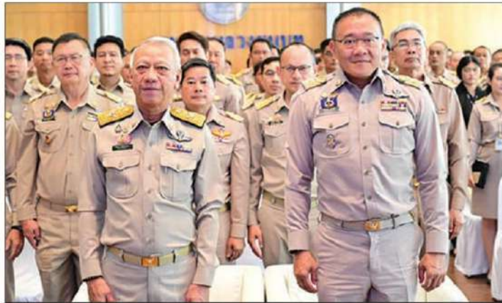
นายพิพัฒน์ รัชกิจประการ รองนายกฯและรมว.คมนาคม มอบนโยบายพัฒนาทางหลวงชนบท เพื่อประชาชน