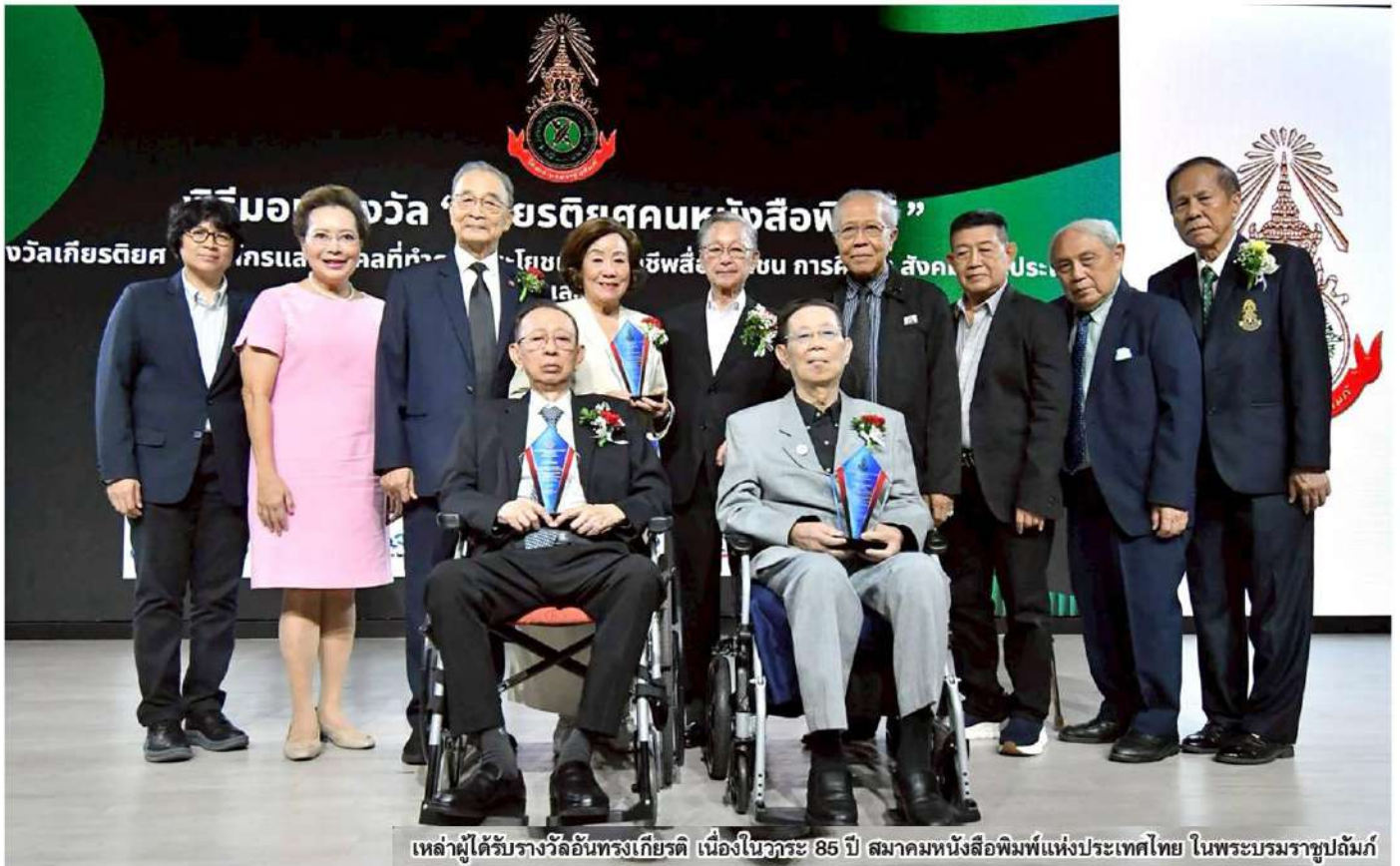
เหล่าผู้ได้รับรางวัลอันทรงเกียรติ เนื่องในวาระ 85 ปี สมาคมหนังสือพิมพ์แห่งประเทศไทย ในพระบรมราชูปถัมภ์

นับเป็นเวลาถึง 85 ปี ที่สมาคมหนังสือพิมพ์แห่งประเทศไทย ในพระบรมราชูปถัมภ์ ยินยัดคู่สังคมไทย โดยในปีนี้มี การพิธีมอบรางวัล “เกียรติยศคนหนังสือพิมพ์” และรางวัล “บุคคล และองค์กรผู้ทำคุณประโยชน์ต่อวิชาชีพสื่อมวลชน การศึกษา สังคม และประเทศ” อีกทั้งรางวัล “พาดหัวข่าวสร้างสรรค์ดีเด่น” ประจำปี 2568 โดยมีบุคลากรในแวดวงสื่อมวลชนเข้าร่วมงานอย่างคับคั่ง เมื่อ 10 พฤษภาคมที่ผ่านมา