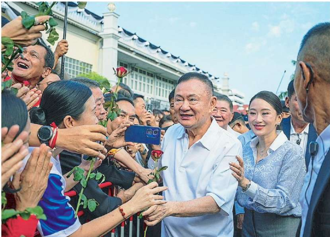
พักโทษ นายทักษิณ ชินวัตร อดีต นาย ก ข เดินยิ้มทักทายรับดอกกุหลาบจากพี่น้องคนเสื้อแดงที่มารอต้อนรับหลังได้รับพักโทษปล่อยตัวออกจากเรือนจำกลางคลองเปรม มีเงื่อนไขคุมประพฤติต่ออีก 4 เดือน จนกว่าจะพ้นโทษวันที่ 9 ก.ย.

นายวิญญัติ ชาติมนตรี ทนายความของนายทักษิณ ชินวัตร อดีต นาย ก ข เปิดเผยว่า หลังจากนั้นนายทักษิณจะต้องไปรายงานตัวที่สำนักงานคุมประพฤติ กรุงเทพมหานคร 1 เดือนละ 1 ครั้ง เป็นเวลา 4 เดือน จนกว่าจะพ้นโทษ ครั้งแรกคือวันที่ 25 พ.ค. ครั้งที่ 2 วันที่ 27 มิ.ย. ครั้งที่ 3 วันที่ 29 ก.ค. และครั้งที่ 4 วันที่ 31 ส.ค. แต่ละครั้งแจ้งเลื่อนออกไปได้หากมีเหตุจำเป็น ส่วนเงื่อนไขเบื้องต้นห้ามประพฤติตนในทางเสื่อมเสีย เช่น ดื่มสุรา เสพยาเสพติด กระทำความผิดอาญาอื่น ต้องพักอาศัยอยู่กับผู้อุปการะตามบ้านเลขที่ที่แจ้งไว้ คือบ้าน