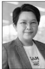
นารอนารี รัฐปัตย์

การจัดการหนี้ด้วยตนเองผ่านช่องทางไลน์ มีดังนี้ 1.เพิ่มเพื่อน LINE@samsocialamc เพื่อตรวจสอบสิทธิ์และลงทะเบียนการใช้งาน โดยกรอกเลขบัตรประชาชน 2.ยืนยันตัวตนด้วยการสแกนบัตรประชาชนและสแกนใบหน้า 3.ตั้งรหัสเข้าใช้งานและยืนยัน OTP 4.การเลือกแผนชำระหนี้ที่เหมาะสมตามความสามารถของตนเอง โดยมีให้เลือก 2 มาตรการที่ผ่อนปรน คือ มาตรการ “จ่าย ปิด จบ” ลดเงินต้นสูงสุด 50% และปิดบัญชีในทันที และมาตรการ “ผ่อนชำระหนี้เป็นงวด” ลดเงินต้น 30% ไม่มีดอกเบี้ย