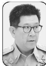
เอกนิติ นิติทัณฑ์ประภาศ

จุดสำคัญอยู่ที่โครงสร้างคณะกรรมการกลั่นกรองการใช้เงินกู้ ที่ เอกนิติ นิติทัณฑ์ประภาศ รองนายกฯ และ รมว.คลัง ได้มอบหมาย มีทั้งหมด 9 คน โดยมีปลัดกระทรวงการคลังเป็นประธาน และกรรมการส่วนใหญ่เชื่อมโยงกับฝ่ายเศรษฐกิจและกระทรวงการคลังอย่างชัดเจน รวมถึงผู้ทรงคุณวุฒิที่รัฐมนตรีว่าการกระทรวงการคลังเป็นผู้แต่งตั้ง