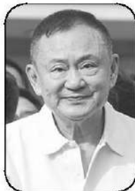
ทักษิณ ชินวัตร

นอกจากนี้ยังมีกรณีขึ้น 14 โรงพยาบาลตำรวจ ซึ่งอยู่ระหว่างการตรวจสอบของคณะกรรมการป้องกันและ