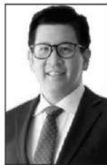
เอกนิต นิติทัศน์ประกาศ

ผ่อนได้นานสูงสุด 3 ปี เงื่อนไขเป็นไปตามที่โครงการกำหนด 5.ตรวจสอบและลงนามสัญญา และ 6.ชำระเงินตามแผนชำระหนี้ที่ได้เลือกไว้โดยการสแกนผ่าน QR Code ทั้งนี้ลูกค้าที่เลือกมาตรการ “ผ่อนชำระหนี้เป็นงวด” การเข้าร่วมโครงการนี้อาจส่งผลให้ระยะเวลาผ่อนลดลงตามระยะเวลาที่เหลือของโครงการ เนื่องจากระยะเวลาการผ่อนชำระของลูกค้าแต่ละรายจะขึ้นอยู่กับเวลาที่ลูกค้าเริ่มเข้าโครงการ...■■ บริษัท ไทยออยล์ จำกัด (มหาชน) หรือ TOP แจ้งต่อตลาดหลักทรัพย์แห่งประเทศไทย (ตลท.) รายงานกำไรสุทธิที่ 19,481 ล้านบาท พุ่งสูงขึ้นถึง 455.9% จากช่วงเวลาเดียวกันของปีก่อน และ 776.0% จากไตรมาสก่อน โดยมี EBITDA อยู่ที่ 31,641 ล้านบาท...โดยสาเหตุสำคัญเกิดจากค่าการกลั่น (GRM) หรือกำไรขั้นต้นจากการผลิตของกลุ่มไม่รวมผลกระทบจากสต็อกน้ำมัน ที่ปรับเพิ่มขึ้นมาอยู่ที่ 14.8 ดอลลาร์สหรัฐต่อบาร์เรล และการรับรู้กำไรจากสต็อกน้ำมัน (Stock Gain) กว่า 22,557 ล้านบาท...เชื่อว่าอีกบริษัทโรงกลั่นน้ำมันที่เหลืออีก 5-6 แห่งในประเทศก็จะมีกำไรจากตรงนี้ไม่ต่างกันหรอก...จังหวะนี้ถ้าคุณเอกนิต นิติทัศน์ประกาศ รองนายกรัฐมนตรีและรัฐมนตรีว่าการกระทรวงการคลัง...จะหยิบเอาประเด็นเรื่อง “ภาษีลากลอย” พูดถึงก็อาจจะได้รับการสนับสนุนจากสังคมไม่น้อยเลยนะ...■■