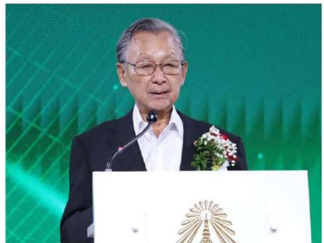
ชวน หลีกภัย อดีตนายกรัฐมนตรี กล่าวปาฐกถา และเป็นประธานมอบรางวัล

หลังการฉายวิดิทัศน์ประวัติความเป็นมาของสมาคม พิธีมอบรางวัลจึงเริ่มต้นขึ้น โดยได้รับเกียรติจาก ฯพณฯ ชวน หลีกภัย อดีตนายกรัฐมนตรี เป็นประธานมอบรางวัลและปาฐกถาพิเศษ โดยกล่าว แสดงความยินดีที่สมาคมให้ความสำคัญ และยกย่องบุคคลที่ทำคุณประโยชน์ให้กับส่วนรวม และแสดงความยินดีกับผู้ได้รับรางวัลในครั้งนี้