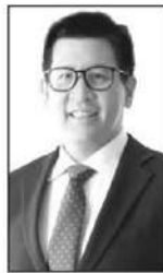
เอกนิติ นิติทัณฑ์ประภาส

■ ■ แวดวงการเงิน...ขอชื่นชมวิสัยทัศน์ของ... คุณเอกนิติ นิติทัณฑ์ประภาส รองนายกรัฐมนตรี และรัฐมนตรีว่าการกระทรวงการคลัง...เกี่ยวกับเรื่อง“การจัดซื้อจัดจ้างภาครัฐ” ที่มองว่าไม่ควรจะเป็นแค่ กระบวนการจัดซื้อภาครัฐหรือการซื้อพัสดุทั่วไปเท่านั้น... แต่ถูกยกระดับให้เป็นหัวใจสำคัญในการวางยุทธศาสตร์เพื่อพัฒนาประเทศ เนื่องจากมีขนาดเศรษฐกิจที่ใหญ่มาก...โดยในบางประเทศ มีมูลค่าสูงถึง 10-20% ของผลิตภัณฑ์มวลรวมในประเทศ (GDP)...และประเทศไทยมุ่งหวังจะใช้กลไกนี้เป็นแรงขับเคลื่อนหลักด้วยเหมือนกัน...คุณเอกนิติย้ำว่า..รัฐบาลไทยได้มีการตั้งเป้าหมายที่จะปรับโฉมการจัดซื้อจัดจ้างภาครัฐ ให้เป็นส่วนสำคัญในการพัฒนาประเทศ...ซึ่งจะดำเนินการใน 4 มิติ... คือ 1. ด้านดิจิทัล (Digital) โดยมุ่งเน้นการใช้ระบบ e-GP เป็นแพลตฟอร์มกลาง โดยมีนโยบายเชื่อมโยงข้อมูลกับระบบของธนาคาร เพื่อให้กลุ่ม SME และวิสาหกิจเพื่อสังคม (SE) ที่เป็นคู่ค้ากับภาครัฐสามารถเข้าถึงแหล่งเงินทุนและสินเชื่อได้สะดวกยิ่งขึ้น... 2.ด้านสิ่งแวดล้อม (Green) โดยส่งเสริม “การจัดซื้อจัดจ้างสีเขียว” เพื่อรองรับเทรนด์โลกยุคใหม่ที่เน้นความยั่งยืน และช่วยบริหารจัดการงบประมาณในช่วงวิกฤตน้ำมันแพง...3. ด้านนวัตกรรม