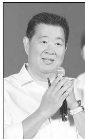
ทรงพล ชิวะปัญญาโรจน์

พร้อมเดินหน้าพัฒนาผลิตภัณฑ์ทางการเงินที่ตอบโจทย์ทุกช่วงชีวิต เช่น สินเชื่อดอกเบียดำ (Soft Loan) ที่สนับสนุนการใช้พลังงานทดแทน ทั้งที่เป็นการกู้ติดตั้งระบบโซลาร์เซลล์และกู้เพื่อซื้อยานยนต์ไฟฟ้า วงเงิน 100,000 ล้านบาท การเปิดจำหน่ายสลากออมสินพิเศษในโอกาสครบรอบก่อตั้งธนาคาร 113 ปี รวมถึงผลิตภัณฑ์เงินฝากที่มีสิทธิประโยชน์ เช่น เงินฝากแบบ