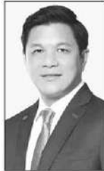
วิทัย รัตนากร

(Innovation) โดยมุ่งสนับสนุนกลุ่ม Startup ของไทยผ่านระบบการจัดซื้อจัดจ้างเพื่อสร้างโอกาสทางการตลาด...4. การเพิ่มแต้มต่อ โดยให้สิทธิประโยชน์แก่กลุ่ม SE และ SME ไทย เพื่อสร้างความได้เปรียบในการแข่งขัน และยกระดับความโปร่งใสและประสิทธิภาพการทำงาน เพื่อสร้างความเชื่อมั่น...!! สำหรับ... แวดวงการเงิน...คิดว่าถ้าจะพิสูจน์ว่าแนวคิดนี้เป็นไปได้ในทางปฏิบัติมากน้อยแค่ไหน...เริ่มต้นเลยคือดูจากการจัดสรรงบประมาณลงทุนในปีงบประมาณ 2570...อยากรู้เหมือนกันว่าโครงการที่ไม่ควรจะนำมาผลาญงบประมาณจะถูกตัดได้มากน้อยแค่ไหน...เดี๋ยวรอกัน... ■ ■ ■ หลังจากที่คุณวิทัย รัตนากร ผู้ว่าการธนาคารแห่งประเทศไทย (ธปท.)...ได้ขอความร่วมมือจากธนาคารพาณิชย์ให้ออกมาช่วยลูกค้าและภาคธุรกิจไทย...รับมือกับผลกระทบที่เกิดจากสงครามในตะวันออกกลาง...แวดวงการเงิน..ขอปรบมือให้...ธนาคารไทยพาณิชย์ จำกัด (มหาชน)...ที่ออกมาชานรับ...ผ่านสินเชื่อเพื่อความยั่งยืนของธุรกิจ (Sustainable Financing) อัตราดอกเบี้ยพิเศษ 2.99% ในปีแรก ประกอบด้วย สินเชื่อสำหรับธุรกิจวงเงินสูงสุด 50 ล้านบาท โดยไม่ต้องใช้หลักประกัน ระยะเวลาผ่อนชำระนาน 10 ปี และสินเชื่อเช่าซื้อรถประหยัดพลังงาน วงเงินสูงสุด 30 ล้านบาท ระยะเวลาผ่อนชำระนานสูงสุด 5 ปี นอกจากนี้ ธนาคารพร้อมให้ความช่วยเหลือผู้ประกอบการทั้งการให้คำปรึกษาเชิงลึก การจัดอบรมสัมมนาผ่านหลักสูตรความยั่งยืน และการติดตามวัดผลการลดการปล่อยก๊าซเรือนกระจกอย่างต่อเนื่อง เพื่อผลักดันให้ผู้ประกอบการเอสเอ็มอีเปลี่ยนผ่านสู่ธุรกิจที่เป็นมิตรต่อสิ่งแวดล้อมในระยะยาว โดยเปิดยื่นกู้ ตั้งแต่วันที่ - 30 มิถุนายน 2569... ■ ■ ■