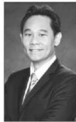
คณา พิชยนันท์

●● จากกรณีที่มีกระแสเรียกร้องให้รัฐบาลเพิ่มภาษีมูลค่าเพิ่ม (VAT) เป็น 10% (จากปัจจุบันที่เก็บอยู่ที่ 7%) เพื่อเพิ่มรายได้เข้ารัฐ...ก่อนหน้านั้น คุณคณา พิชยนันท์ เลขาธิการสภาพัฒนาการเศรษฐกิจและสังคมแห่งชาติ (เลขาฯ สภาฯ) ...ให้ความเห็นว่าแม้จะเป็นการเพิ่มรายได้เข้ารัฐแต่ไม่เหมาะสมกับสภาพเศรษฐกิจไทยในขณะนี้...ล่าสุด คุณเอกนิติ นิติทัณฑ์ประภาศ รองนายกรัฐมนตรีและรัฐมนตรีว่าการกระทรวงการคลัง...ก็ออกมาย้ำอีกครั้งว่าเศรษฐกิจปัจจุบันยังไม่เอื้ออำนวยต่อการขึ้นภาษี VAT แม้ว่ากระทรวงการคลังยังยึดกรอบการคลังระยะปานกลางที่จะทยอยเพิ่มขึ้น VAT เพื่อเพิ่มรายได้ให้กับประเทศ โดยจะต้องพิจารณาความพร้อมของภาวะเศรษฐกิจเป็นสำคัญ...ดังนั้น ที่ประชุมคณะรัฐมนตรี (ครม.) เมื่อวันที่ 21 เมษายนที่ผ่านมา...จึงมีมติขยายเวลาการลดอัตราจัดเก็บภาษี VAT จาก 10% เหลือ 7% ที่จะสิ้นสุดในวันที่ 30 กันยายน 2569...ออกไปอีก 1 ปี จนถึงวันที่ 30 กันยายน 2570 ....ส่วนการออกพระราชกำหนด (พ.ร.ก.) ู้เงินวงเงินไม่เกิน 5 แสนล้านบาท