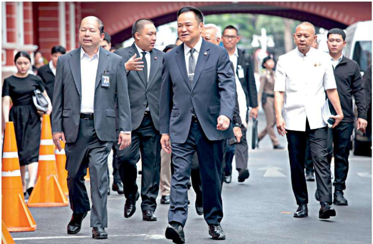
▲ ประชุม สมช. ...นายอนุทิน นายวีระกุล นายกรัฐมนตรี เดินทางไปเป็นประธานการประชุมสภาความมั่นคงแห่งชาติ (สมช.) โดยที่ประชุม สมช. เห็นชอบยกเลิก MOU 44 โดยใช้กลไกอนุสัญญาสหประชาชาติว่าด้วยกฎหมายทางทะเล (UNCLOS) แทน