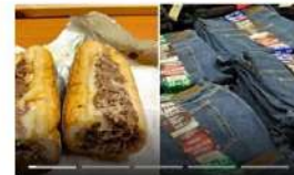
Kirkland Products That Are Big Brands In Disguise