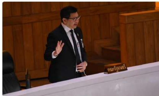
Finance Minister Ekniti Nitithanprapas (left) speaks which claim the government is preparing to take out a 500-billion-baht emergency loan to stabilise the economy at a parliament session on Thursday.