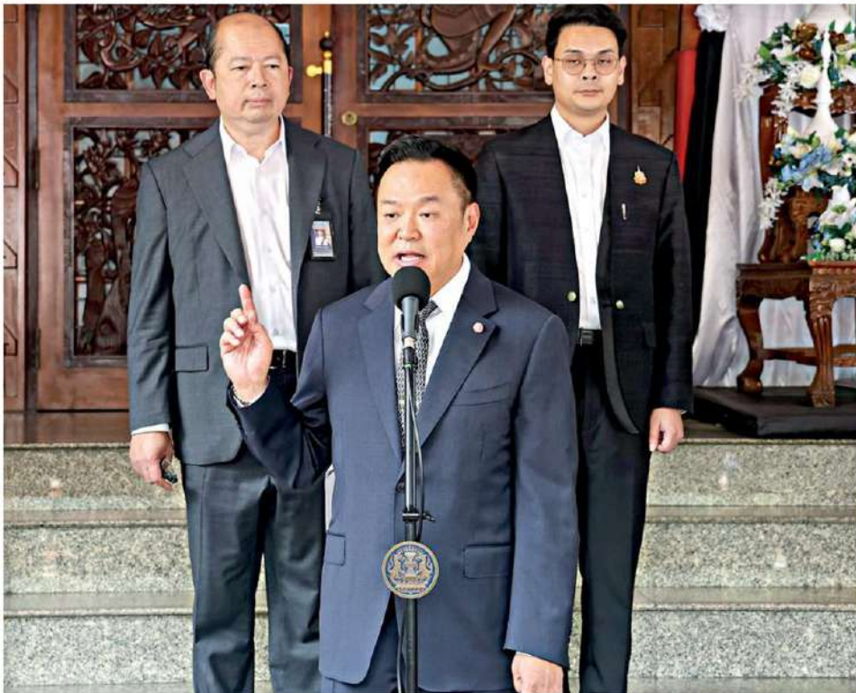
▲ ฉีกเอ็มโอยู44...นายอนุทิน ชาญวีรกูล นายกรัฐมนตรี ให้สัมภาษณ์หลังเป็นประธานการประชุมสภาความมั่นคงแห่งชาติ (สมช.) โดยที่ประชุมมีมติยกเลิก MOU 44 ไม่ต้องสนเชมร ที่ทำเนียบรัฐบาล