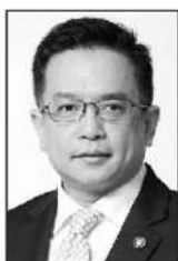
วินิจ วิเศษสุวรรณภูมิ

ปีงบประมาณ 2569 (ตุลาคม 2568-กุมภาพันธ์ 2569)... รัฐเก็บรายได้สูงถึง 1.04 ล้านล้านบาท สูงกว่าเป้าหมาย 1,280 ล้านบาท...โดยได้แรงหนุนจากการปรับขึ้นภาษีน้ำมัน 1 บาท/ต่อลิตร ทำให้รายได้กรมสรรพสามิตพุ่ง 8.3% ขณะที่กรมสรรพากรยังคงเป็นรายได้หลักกว่า 8.1 แสนล้านบาท และรัฐวิสาหกิจนำส่งรายได้เพิ่มขึ้นถึง 24.4% ...แม้จะมีแรงกดดันอยู่บ้างจากการคืนภาษีที่เพิ่มขึ้นกว่า 13% รวมถึงรายได้จากกรมศุลกากรที่ต่ำกว่าเป้า และการจัดสรรภาษีมูลค่าเพิ่มให้ท้องถิ่น ทำให้รายได้สุทธิเกินเป้าเพียงเล็กน้อย...ส่วนครึ่งหลังของปีงบประมาณ...แฉว่า... กระทรวงการคลัง...ได้ประเมินแล้วว่า จากพิษของสงครามในตะวันออกกลาง...มีความเสี่ยงที่รายได้รัฐจะชะลอตัว... ก็เลยพยายามจะบอกว่า...ไม่อาจจะสามารถปรับลดภาษีน้ำมันได้ง่าย เนื่องจากจะกระทบรายได้ทันที เช่น ลด 1 บาท/ลิตร สูญรายได้ราว 2,800 ล้านบาทต่อเดือน และหากลดถึง 5 บาท/ลิตร อาจกระทบสูงถึง 14,000 ล้านบาทต่อเดือน... ส่วนตัวเลขรายได้รัฐในเดือนมีนาคม (ซึ่งเกิดสงครามพอดี) และตัวเลขของ 6 เดือนหลังของปีงบประมาณ 2569...หลังสงครามตึงได้ยื่นคำแถลงอย่างเป็นทางการจาก คุณวินิจ วิเศษสุวรรณภูมิ ผู้อำนวยการสำนักงานเศรษฐกิจการคลัง (ผอ.สศก.) และในฐานะโฆษกกระทรวงการคลัง... ■ ■ ■