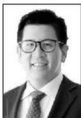
เอกนิติ นิติทัณฑ์ประภาศ

■ ■ ■ มันน่าเอาหนังกัดปิดปากคนที่แนะนำ...คุณเอกนิติ นิติทัณฑ์ประภาศ รองนายกรัฐมนตรีและรัฐมนตรีว่าการกระทรวงการคลัง...ให้ตอบกระแสเรียกร้องให้คลังลดภาษีสรรพสามิตน้ำมันเพื่อช่วยประชาชน...ว่า “คลังทำอย่างนั้นไม่ได้ เพราะจะกระทบต่อรายได้รัฐและส่งผลกระทบต่อรายได้รัฐและส่งผลไปถึงเรื่องค่าใช้จ่ายในการรักษาพยาบาลประชาชน”...เมื่อตอบสังคมแบบนี้หมัดกับกับภาพของ “เทคโนโลยี” ที่อยากออกมาช่วยประเทศชาติ... เพราะการตอบคำถามอย่างนี้คุณเอกนิติ คือ “นักการเมือง” เต็มตัว...!! จริงๆ สังคมก็รับรู้แหละว่ารัฐบาลมีข้อจำกัดด้านงบประมาณระดับหนึ่ง...เพราะ 2 รัฐบาลก่อนหน้านี้ “แจกเงิน” ไปเยอะจนทำให้หนี้สาธารณะวิ่งขึ้นไปใกล้ชนพาดาน (70% ต่อจีดีพี)...แวดวงการเงิน...เชื่อว่าถ้าคุณเอกนิติให้คำตอบแบบ “นักการคลัง” จริงๆ ไม่น่าจะโดนกระแสติกลับมากเท่านี้...และ...แวดวงการเงิน...ก็มีอาจจะแนะนำได้หรือกว่า...คำตอบที่ดีกว่านี้ควรเป็นเช่นไร...เพราะฉลาดไม่เท่าคุณเอกนิติอยู่แล้ว... ■ ■ ■ พูดถึงรายได้รัฐ...กระทรวงการคลัง...ก็เพิ่งจะมาแถลงไปเร็วๆ นี้ว่า 5 เดือนแรก