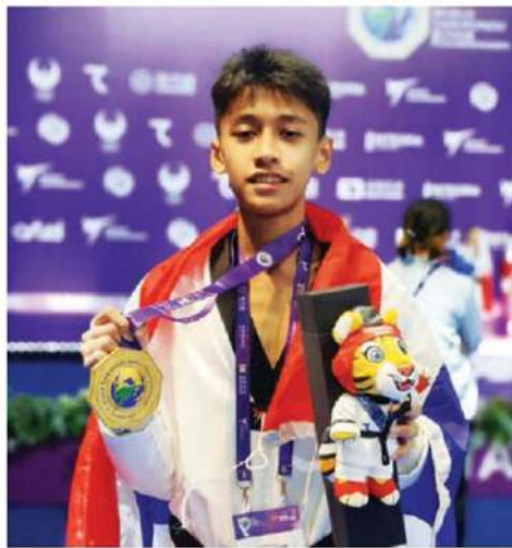
“กันดั้ม” ักญจน์บุษกร 8 คว่าเหรียญทองเทควันโด ศึกเยาวชนชิงแชมป์โลก 2026