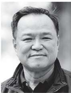
อนุทิน ชาญวีรกูล

ทีมเศรษฐกิจ รัฐบาล “นายกอนุทิน ชาญวีรกูล” เร่งงานด่วนช่วยชาวบ้านรับแรงกระแทกจากราคาน้ำมัน ทั้งค่าครองชีพ ค่าเดินทาง และสนับสนุนการปรับเปลี่ยนไปใช้พลังงานทดแทน