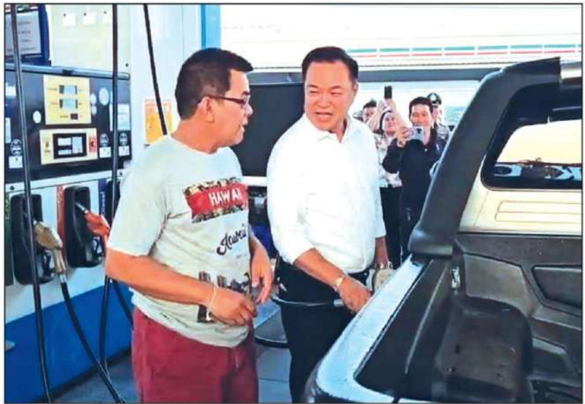
▲ ผู้ตรวจ : นายอนุทิน นายกรัฐมนตรีและรมว.มหาดไทย ลงพื้นที่กลุ่มตรวจน้ำมันเชื้อเพลิงที่แยกโคโยต้า อ.เมือง จ.สุโขทัย โดยไม่มีการแจ้งล่วงหน้า ซึ่งนายกฯ ได้พูดคุยกับประชาชนที่เข้ามาเติมน้ำมันอย่างเป็นกันเอง พร้อมทั้งสอบถามเกี่ยวกับการใช้น้ำมัน เพื่อนำไปใช้ประกอบการตัดสินใจแก้ปัญหาพลังงานต่อไป

นายอนุทิน กล่าวว่า ขอขอบคุณประชาชน ที่ตระหนักรับมือต่อสถานการณ์