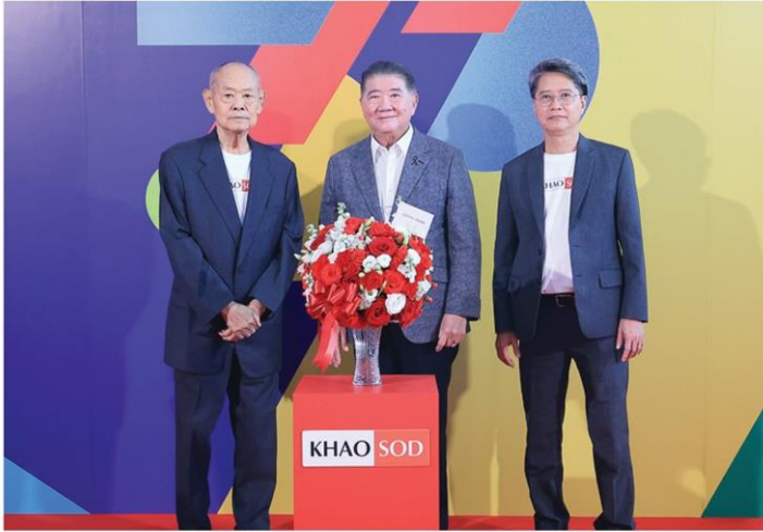
ภูมิธรรม เวชยชัย แกนนำพรรคเพื่อไทย