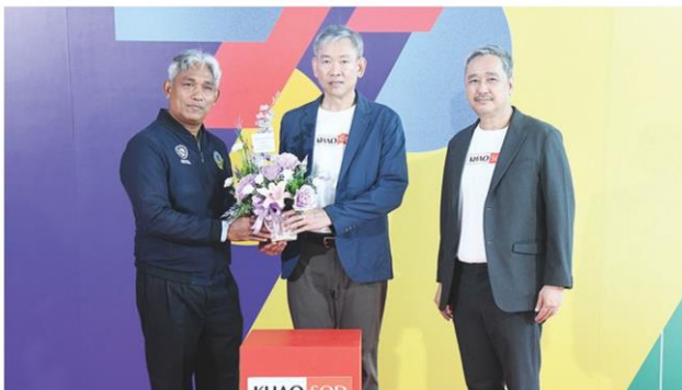
ตัวแทนสมาคมกีฬามวยปล้ำฯ