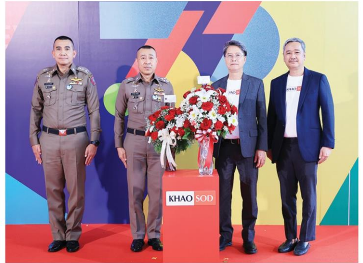
พล.ต.อ.ตำรวจ นวลมา รองผบ.ตร.