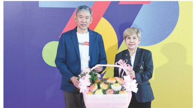
ตัวแทนสมาคมกีฬาตะกร้อฯ