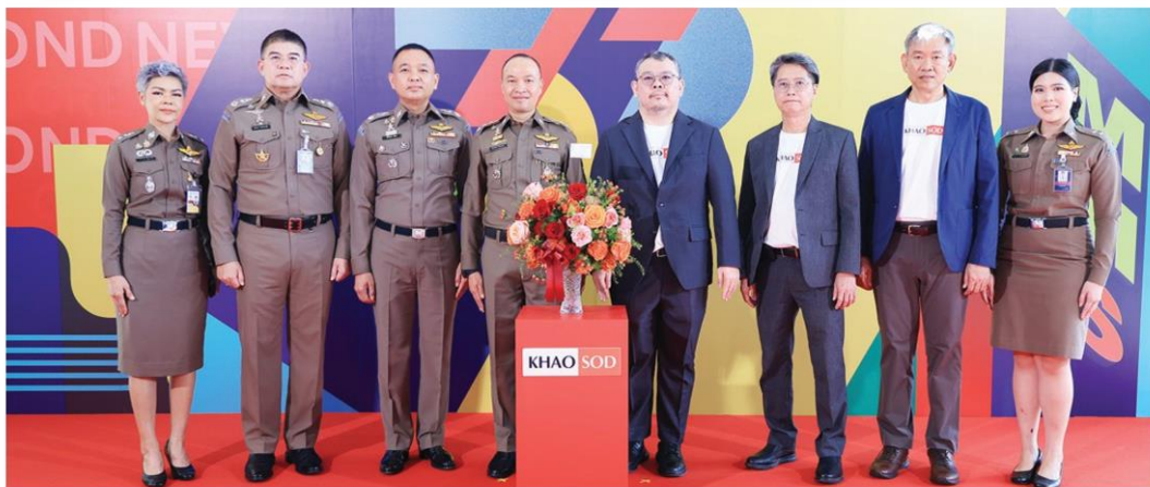
ทีมโฆษก ดร.ร่วมอวยพร