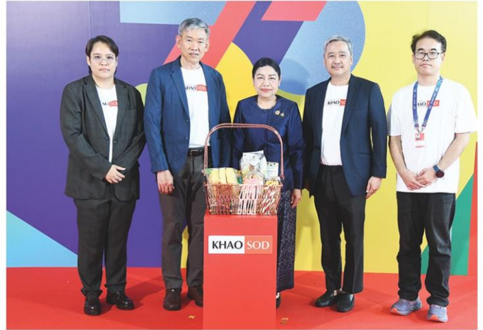
โปรดปราน สมานมิตร รองผู้ว่าการกีฬาฯ