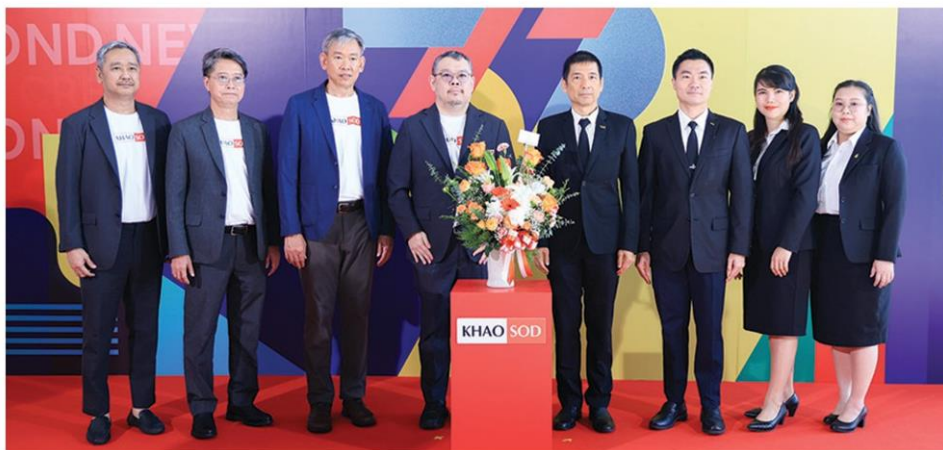
สำนักงานอัยการสูงสุด