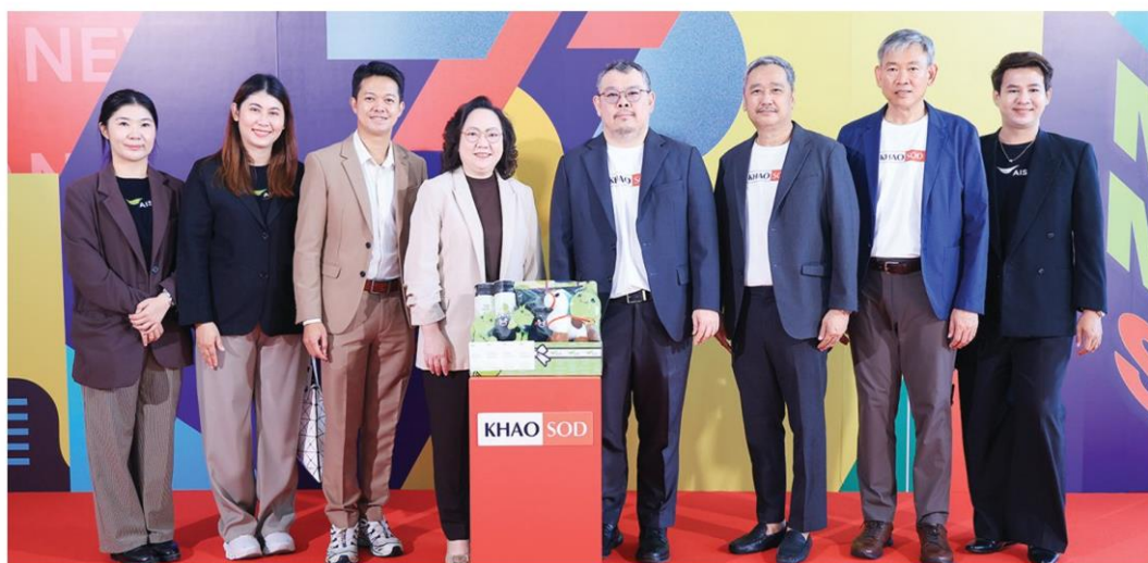
เอไอเอสแท็กทีมมายินดี

รหัสข่าว: C-260411037005 (10 เม.ย. 69/05:45)