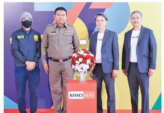
กองบังคับการสืบสวนนครบาล