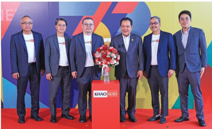
พ.ต.อ.ทวี สอดส่อง หัวหน้าพรรคประชาชาติ