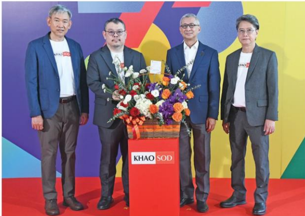
ประธานคณะกรรมการโอลิมปิกไทย