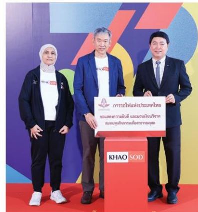
การรถไฟฯ