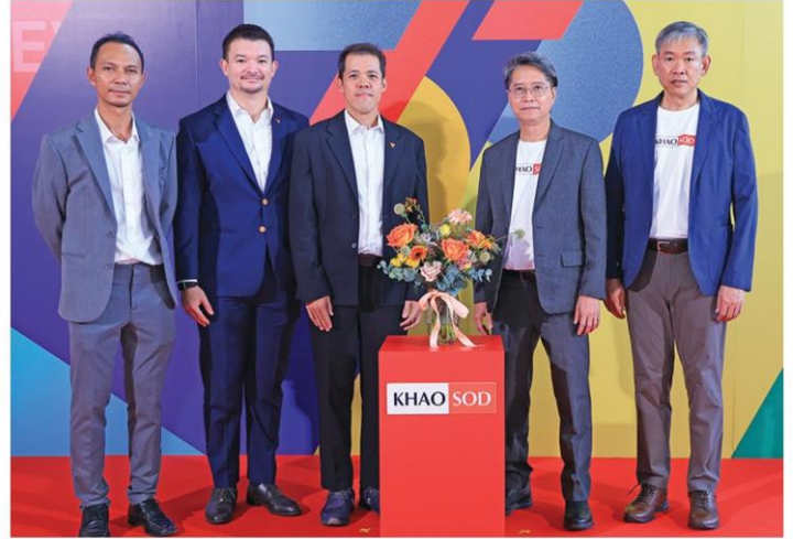
ตัวแทนพรรคประชาชน