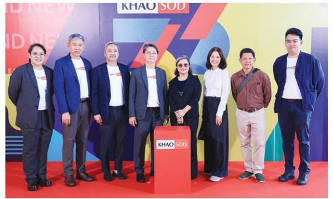
ป่าใหญ่ตรีเฒ่า