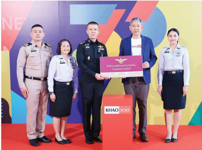
สำนักงานปลัดกระทรวงกลาโหม