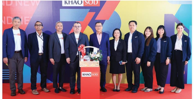
ปตท.ยกทีมแสดงความยินดี