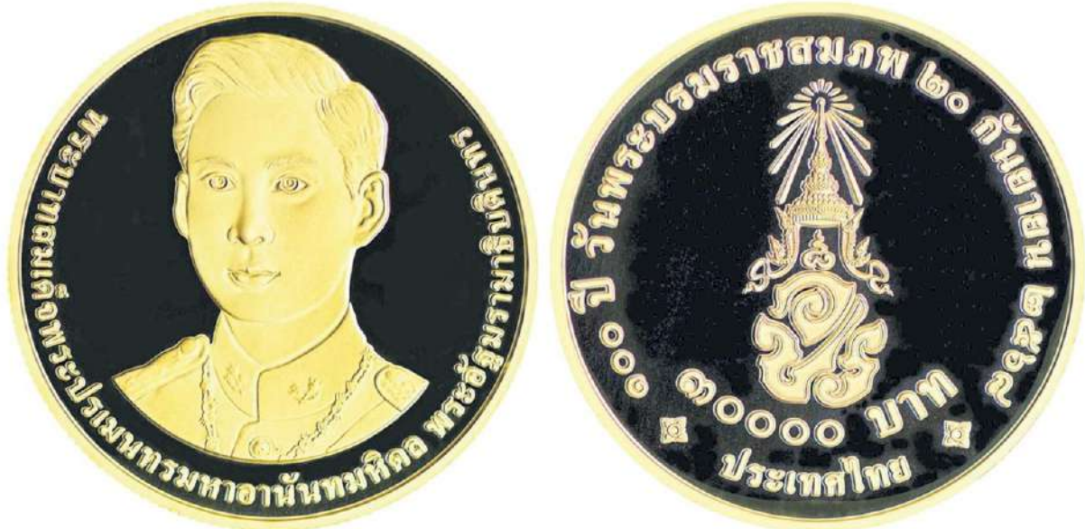
A commemorative coin marking the 100th birth anniversary of His Majesty King Ananda Mahidol.