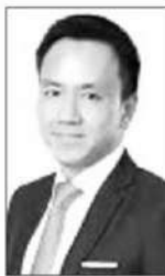
พันธ์ทอง ลอยกุลนันท์

■■ อุตสาหกรรมเหล็กของไทยจะไร้กำลังผลิตเพียงแก่ 30%...เพราะความต้องการใช้เหล็กในประเทศไม่ได้เพิ่มขึ้นและมีการนำเข้าเหล็กจากต่างประเทศเข้ามาจำนวนมาก...แม้ว่าไทยจะมีข้อตกลงทางการค้ากับหลายประเทศซึ่งส่งผลกระทบต่อผู้นำเข้าด้านภาษี....แต่ก็ยังพบเห็นผู้นำเข้าที่ไม่ดีหาช่องทางหลีกเลี่ยงอากรเหล็กเสียภาษีอยู่เรื่อยมาจนถึงวันนี้...ซึ่งก็ต้องชื่นชม คุณพันธ์ทอง ลอยกุลนันท์ อธิบดีกรมศุลกากร กับลูกน้องที่เข้มแข็งในการตรวจปราบ...กองสืบสวนและปราบปรามกรมศุลกากร...ได้ทำการตรวจสอบสินค้าตามใบขนสินค้าขาเข้า ซึ่งสำแดงเป็นแผ่นพื้นทำด้วยเหล็ก มีต้นทางจากประเทศจีน ณ ท่าเรือเอกราช...ผลการตรวจสอบพบว่าสินค้าไม่ตรงตามที่สำแดง โดยเป็นโพรไฟล์กลวงทำจากเหล็กกล้าไม่เป็นสนิม จึงไม่สามารถใช้สิทธิยกเว้นอากรและลดอัตราอากรศุลกากรสำหรับเขตการค้าเสรีอาเซียน-จีน (ACN) ส่งผลให้อากรและอากรตอบโต้การทุ่มตลาดขาด