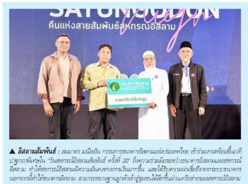
▲ อิสลามสัมพันธ์ : สมเด็จพระมณเฑียร กรมการธนาคารอิสลามแห่งประเทศไทย เข้าร่วมงานพร้อมกันเวที ปฐกถาพิเศษใน "วันสหกรณ์อิสลามสัมพันธ์ ครั้งที่ 20" ถึงความร่วมมือระหว่างธนาคารอิสลามและสหกรณ์ อิสลาม ทำให้สหกรณ์อิสลามมีความมั่นคงทางการเงินมากขึ้น และได้รับความน่าเชื่อถือจากระบบธนาคาร นอกจากนี้ทำให้ธนาคารอิสลาม สามารถขยายฐานลูกค้าเข้าสู่ชุมชนได้ลึกขึ้นผ่านเครือข่ายของสหกรณ์อิสลาม