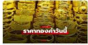
ราคาทองคำวันนี้ 6 เม.ย. 69 ครั้งที่ 1 ส่ง 600 บาท เมื่อสัปดาห์ก่อนร่วงตวบ่า