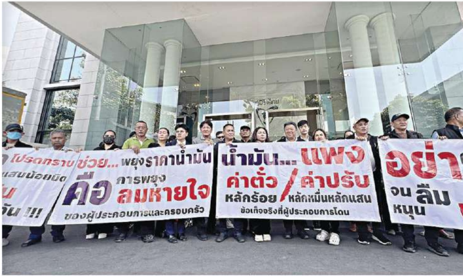
▲ จี้เยียวยา... ผู้ประกอบการรถโดยสารทั่วประเทศ บุกยื่นหนังสือเรียกร้องขอให้รัฐบาลช่วยเหลือ เยียวยาจากพิษน้ำมันแพงต้นทุนสูง หากไม่ได้รับคำตอบ 9 เม.ย.นี้หยุดวิ่งทั่วประเทศ ที่พรรคภูมิใจไทย