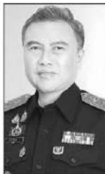
พรชัย วีระเวช

กว่า 1,000,000 บาท...ซึ่งการกระทำดังกล่าวเป็นความผิดฐานสำแดงเท็จเพื่อหลีกเลี่ยงอากร ตามพระราชบัญญัติศุลกากร พ.ศ. 2560 และประกาศคณะกรรมการพิจารณาการทุ่มตลาดและการอุดหนุน...■■ หลายหน่วยงานของรัฐได้ร่วมบูรณาการดำเนินการมาตรการเพื่อแก้ไขและป้องกันภาวะการขาดแคลนน้ำมันเชื้อเพลิงในช่วงสงกรานต์ 6-17 เมษายน 2569...ซึ่งกรมสรรพสามิตก็เป็นหนึ่งในหน่วยงานที่ร่วมดำเนินการด้วย..ล่าสุด คุณพรชัย วีระเวช อธิบดีกรมสรรพสามิต...ได้ปล่อยแถวชุดสายตรวจสนับสนุนการตรวจคลังน้ำมันและสถานีบริการน้ำมันทั่วประเทศ...ภารกิจสำคัญ ได้แก่ การสนับสนุนหน่วยงานที่เกี่ยวข้องในการลงพื้นที่ตรวจสอบข้อเท็จจริงในคลังน้ำมันและสถานีบริการน้ำมันให้เป็นไปตามกฎหมาย การตรวจสอบปริมาณน้ำมันและการจำหน่ายในแต่ละพื้นที่ การเฝ้าระวังและติดตามสถานการณ์ ตลอดจนการป้องกันและสกัดกั้นพฤติกรรม การกักตุนหรือฉวยโอกาส และการสนับสนุนข้อมูลร่วมกับหน่วยงานที่เกี่ยวข้อง เพื่อให้สามารถแก้ไขสถานการณ์ได้อย่างรวดเร็วและมีประสิทธิภาพ...โดยมาตรการดังกล่าวมุ่งเน้นการเฝ้าระวังพื้นที่เสี่ยง และเส้นทางสายหลักทั่วประเทศ...■■