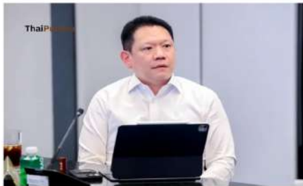
นายสุวกร แสวงกิจ ปลัดกระทรวงการคลัง

"ปลัดคลัง"เตรียม พ.ร.ก.โยกงบ 8.4 หมื่นล้านบาท ชง ครม.เคาะ 21 เม.ย.นี้ แจก "คนละครึ่ง พลัส" ภายในเดือน พ.ค.นี้