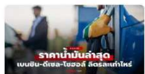
ราคาน้ำมันวันพรุ่งนี้ 7 เม.ย. 69 เช็กราคาน้ำมันดีเซล เบนซิน ล่าสุด สัปดาห์ไหน?