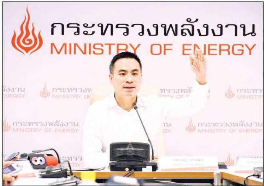
▲ หั่นค่าลิ้น 2 บาท : นายเอกนัฏ พร้อมพันธุ์ รมว.พลังงาน ในฐานะประธานคณะกรรมการบริหารนโยบายพลังงาน (กบง.) แถลงหลังประชุมกับกลุ่มโรงกลั่นในประเทศไทย โดยที่ประชุมมีมติให้ลดราคากำราคารถล้นน้ำมันดีเซล B7 และ B20 หน้าโรงกลั่น 2 บาทต่อลิตร

“ปกติแล้วระวางของเรือแต่ละลำจะไม่เท่ากัน เรือบางลำก็บรรทุกน้ำมันชนิดเดียว บางลำก็บรรทุกน้ำมันหลายชนิด จึงต้องเชิญหน่วยงานที่ควบคุมโดยเฉพาะอย่างกรมธุรกิจพลังงานและกรมสรรพสามิตมาคอยดูตัวเลขทั้งหมดเพื่อให้เป็นตัวเลขเดียวกัน ซึ่งเราก็ตรวจพบความผิดปกติว่าเรือบางลำมีการใช้เวลาในการวิ่งนานผิดปกติ โดยเฉพาะเส้นทางจากภาคตะวันออกลงไปยังพื้นที่ภาคใต้จังหวัด