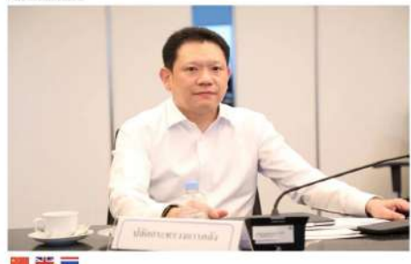
ภาพ: ส.ส. พรรคภูมิใจไทย

คลัง ชง ครม. 11 เม.ย. นี้ จัดงบ 2.9 พันล้าน เติมเงินบัตรสวัสดิการแห่งรัฐ 100 บาท - ฉุกเฉินกลุ่มชนส่งสุราคาปลังงาน