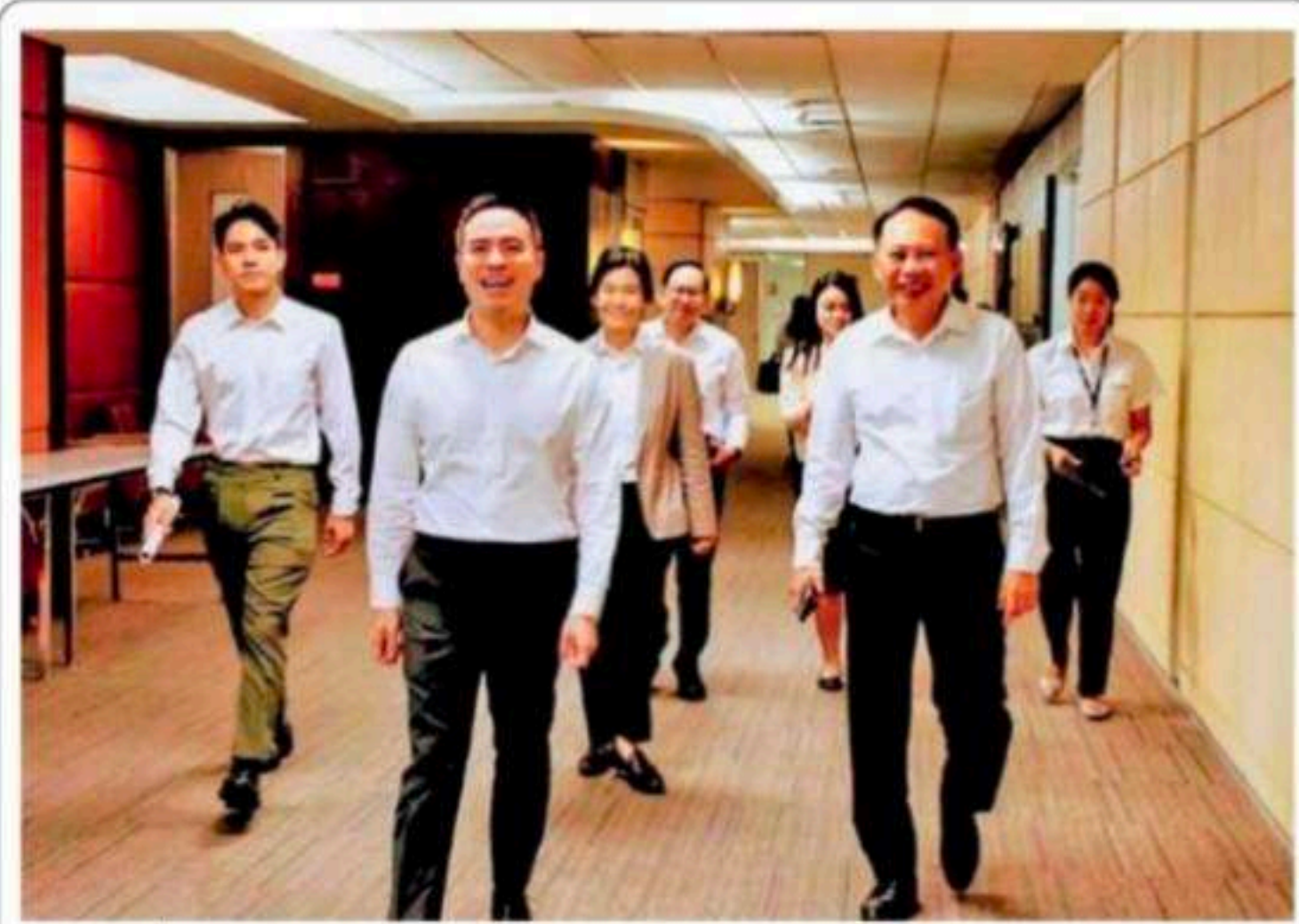
ลดค่ากลั่น - นายเอกนัฏ พร้อมพันธุ์ รมว.พลังงาน กำลังเดินไปประชุมคณะกรรมการบริหารนโยบายพลังงาน (กบง.) และได้ใช้อำนาจตาม พ.ร.ก.แก้ไขและป้องกันภาวะการขาดแคลนน้ำมันเชื้อเพลิง พ.ศ.2516 เป็นครั้งแรก ในการสั่งลดราคาหน้าโรงกลั่นสำหรับน้ำมันดีเซลลง 2 บาทต่อลิตร ส่งผลให้ราคาหน้าปั๊มปรับลดลงตาม คาดว่าจะเริ่มวันที่ 9 เม.ย. 2569

ผู้จัดการรายวัน360° - “อนุทิน” ประกาศมาตรการประหยัดน้ำมัน เตรียมปิดปั๊มน้ำมัน 4 ท่อมถึงตี 5 หลัง 20 เม.ย. ให้คนเที่ยวสงกรานต์ก่อน “เอกนัฏ” จัด พ.ร.ก.แก้ไขและป้องกันภาวะการขาดแคลนน้ำมันเชื้อเพลิง ใช้ครั้งแรก ลดราคาหน้าโรงกลั่นลงทันทีลิตรละ 2 บาท เฉพาะดีเซล รอลงราชกิจจานุเบกษาวันนี้ ก่อน