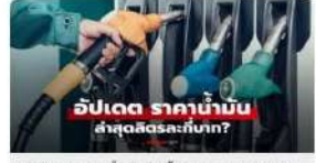
อัปเดต ราคาน้ำมันวันที่ 7 เมษายน 2569 เบนซิน-ดีเซล-แก๊สโซฮอล์ สัปดาห์ไหน?