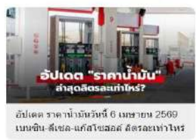
อัปเดต ราคาน้ำมันวันที่ 6 เมษายน 2569 เบนซิน-ดีเซล-แก๊สโซฮอล์ สัปดาห์ไหน?