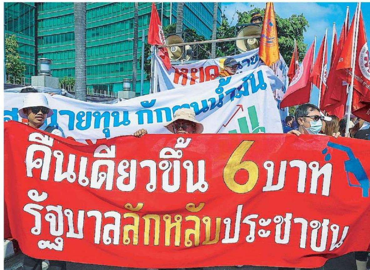
อย่าลืมหลับ สมาพันธ์สมาพันธ์แรงงานไทย (สสรท.) สมาพันธ์แรงงานรัฐวิสาหกิจสัมพันธ์ (สรส.) นำมวลชนกว่า 100 คน ชุมนุมหน้ากระทรวงพลังงาน คัดค้านรัฐบาลลักหลับปรับขึ้นราคาน้ำมันรายวัน กระทบค่าครองชีพประชาชน.

วันเดียวกัน เจ้าหน้าที่กรมสอบสวนคดีพิเศษ พร้อมพนักงานสอบสวน ภ.จ.สุราษฎร์ธานี เตรียมเข้าตรวจสอบหลักฐานและสอบปากคำผู้เกี่ยวข้องบริษัทคลังน้ำมันแห่งหนึ่งของผู้ค้าน้ำมันตามมาตรา