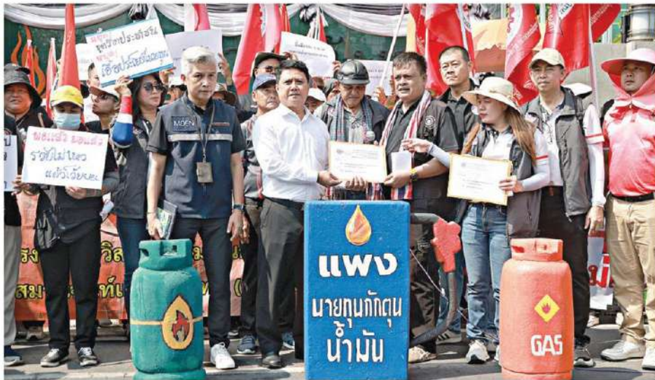
▲ มีอบฮือ...ภาคประชาชน-เครือข่ายแรงงานสื่อบุกกระทรวงพลังงาน ยื่นหนังสือถึง รว.พลังงานขอให้รีบแก้ไขวิกฤติปัญหาพลังงาน ทั้งน้ำมันขาดแคลน ค่าไฟฟ้าแพง สินค้าขึ้นราคาต่อเนื่องจนเดือดร้อนทั่วประเทศ

ชาวบ้านอ่วม น้ำมันดีเซลขยับขึ้นอีกลิตรละ 3.50 บาท ทะลุ 47.74 บาท เผยตั้งแต่สงครามขึ้นมาแล้ว 17.80 บาท ชัดแหลกขบวนการ "ขายชาติ-เลว" ลักลอบขายน้ำมันเขมร "อนุทิน" เตือด ตั้งหน่วยไล่ล่าพวกกักตุนฉวยโอกาสขึ้นราคาสินค้า แย้มพบเป็นรูปแบบบริษัท ปิดอู่มีนายทุน ยันมีสำนึกได้มาเพราะประชาชนเลือก "เอกนิติ" สั่งต้องลดค่าการกลั่น-วอร์ ฟรีเมียม ♦ อ่านต่อหน้า 10