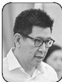
เอกนิติ นิติทัณฑ์ประภาศ

● ก่อนหน้านี้ “เอกนิติ นิติทัณฑ์ประภาศ” รองนายกรัฐมนตรีและ รมว.คลัง จะเข้ามาทำหน้าที่แทน “พิพัฒน์ รัชกิจประการ” บอกชัดแล้วว่า จะเลิกอุม้ำมัน ซึ่งมีเฉพาะกลุ่มใช้รถแต่จะหันอุมคนแทน คือประชาชน โดยเฉพาะกลุ่มเปราะบางด้วยมาตรการ “ไทยช่วยไทยพลัส” เอา “คนละครึ่งพลัส” กับ “บัตรสวัสดิการแห่งรัฐ” มาอยู่ในระบบเดียวกัน และปลดล็อกทั้ง 2 โครงการ ซึ่งต่อไปตรคนจนจะสแกนใช้จ่ายร้านอาหารได้ จากเดิมได้แค่ร้านค้าธงฟ้า ส่วนคนได้สิทธิคนละครึ่งพลัส ต่อไปก็ใช้จ่ายผ่านร้านธงฟ้าได้ด้วย กระทรวงคลังวางไหม้ไลน์คร่าวๆ คนละครึ่งพลัส เฟสใหม่ ที่คนไทยรอดด้วยใจจดใจจ่อ คาดเปิดลงทะเบียนโครงการภายในเดือนนี้ ตรวจสอบสิทธิ์และประกาศผลได้ปลายเดือน เริ่มใช้จ่ายจริงภายในเดือน พ.ค. ถ้าต้องเร่งเต็มสปีดอย่าง