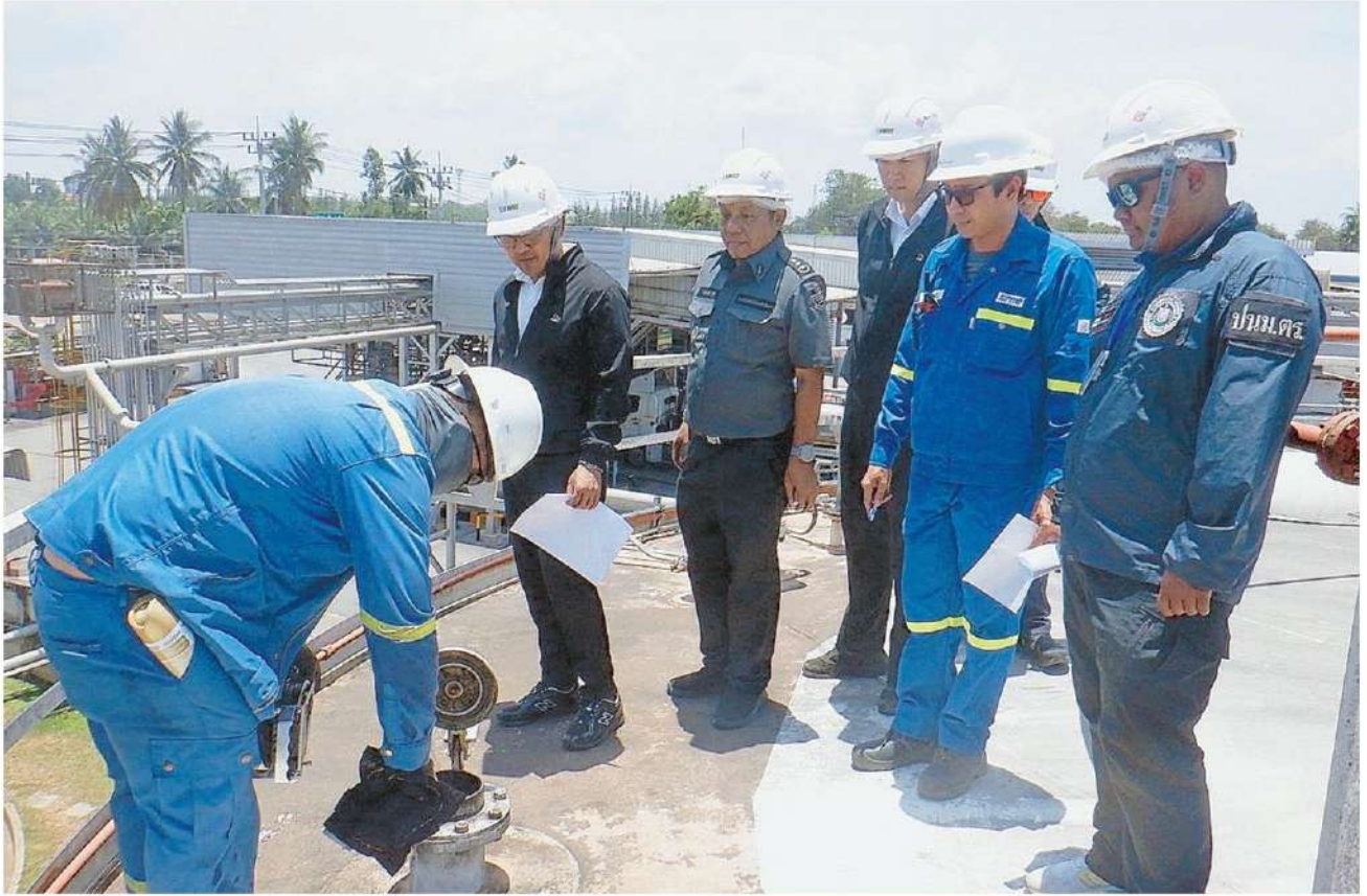
▲ ตรวจสอบใหญ่ เจ้าหน้าที่เข้าตรวจสอบคลังน้ำมันขนาดใหญ่ใน จ.สุราษฎร์ธานี ของผู้ค้าน้ำมันตามมาตรา 7 และผู้ค้าน้ำมันตามมาตรา 10 แห่ง พ.ร.บ. การค้าน้ำมันเชื้อเพลิง 2543 เป็นผู้ค้าน้ำมันรายใหญ่รับผิดชอบพื้นที่ขนส่งน้ำมันในภาคใต้ตอนบนรวม 6 จุด พบบางจุดผิดปกติ มีการกักตุนก่อนปรับราคา.

ผลการศึกษาครั้งนี้จะนำเสนอคณะรัฐมนตรี (ครม.) วันที่ 6 เม.ย. เนื่องจากเป็นเรื่องเร่งด่วนที่ต้องช่วยเหลือเยียวยาแบ่งเบาภาระค่าครองชีพของประชาชน