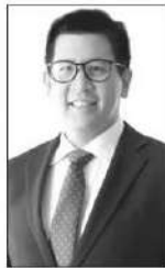
เอกนิติ นิติทัณฑ์ประภาศ

●● ภาษีสรรพสามิต...วัตถุประสงค์หลักคือกำกับพฤติกรรมในการบริโภคสินค้าต่างๆ ของประชาชน...ส่วนใครเรียกร้องให้รัฐบาลเร่งลดภาษีสรรพสามิตน้ำมันเพื่อช่วยให้ราคาน้ำมันถูกลงบ้างนั้น...คุณเอกนิติ นิติทัณฑ์ประภาศ รองนายกรัฐมนตรีและรัฐมนตรีว่าการกระทรวงการคลัง...อธิบายหลักคิดของรัฐบาลในการบริหารจัดการวิกฤตราคาพลังงานไว้แบบนี้ว่า...หัวใจหลักของเรื่องคือ “ไม่ใช่เรื่องราคาแต่เน้นไปที่ช่วยเหลือคนที่ได้รับผลกระทบจากราคาน้ำมัน”...แต่ถึงกระนั้นรัฐบาลก็ไม่ได้ปล่อยให้ราคาน้ำมันราคาพลังงานวิ่งขึ้นไปตามทุนที่แท้จริง ซึ่งสูงมากจนประชาชนจะรับไม่ไหว...รัฐบาลจึงบริหารราคาผ่านกองทุนน้ำมันเชื้อเพลิง...ซึ่งจะชดเชยไปถึงลิตรละ 25-30 บาทก็ได้...กระทรวงการคลังจะกำประกันเงินกู้ให้กับกองทุนน้ำมันฯวงเงิน 1.5 แสนล้านบาท...ส่วนภาษี