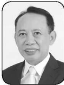
ประเสริฐ ลินสุขประเสริฐ

1 ทยโพสต์ “อิสราภาพแห่งความคิด” www.thaipost.net ร้องจ่าก! รับสงกรานต์ ชื่นรวิวกุ เลิกลักหลับ คณะกรรมการบริหารกองทุนน้ำมันเชื้อเพลิง (กบน.) ที่มี “ประเสริฐ ลินสุขประเสริฐ” ปลัดกระทรวงพลังงาน ทำหน้าที่หัวโต๊ะแทน รมว.พลังงาน รัฐบาลจึงมตก่อนฟ้ามีด วันศุกร์นี้อีกสามบาทห้าสิบ ดีเซลทะเล 47.74 บาท/ลิตร จริงล้วนๆ ไม่เหมือนช่วงเย็นวันพุธที่ผ่านมา ต้องเช็กข่าวกันวัน จนโดน โขเซียลวิจารณ์สนั่น ชาวจริงหนักกว่าเฟกนิวส์ ตลกร้ายของคนใช้รถปล่อยข่าวขึ้นราคาน้ำมันทุกชนิด 3 บาท/ลิตร ก่อนที่กระทรวงพลังงาน แจ้งเตือนทันที ต่อด้วยโฆษก ศบค. แถลงได้ ถัดมาอีกชั่วโมงกว่า กบน. มีมติขึ้นดีเซล 3.50 บาท กลุ่มเบนซิน ปรับ 1.20 บาท ตัวเลขสูงสุดเป็นประวัติการณ์ แต่ครึ่งเดือนขยับถึง 17.80 บาทต่อลิตร ปรับครั้งแรก 18 มี.ค. 50 สตางค์ 21 มี.ค. 70 สตางค์ 24 มี.ค. 1.80 บาท ดีเซลอยู่ที่ 32.94 บาท โกลด์และเพดาน 33 บาท จากนั้นช่วงเย็นวันเดียวกัน นายกฯ ประกาศยกเลิกเพดานปล่อยลอยตัวตามกลไกตลาด เล่นเอา 26 มี.ค. ขึ้นพรวดทีเดียว 6 บาท ต่อมา 31 มี.ค. ขยับอีก 1.80 บาท 2 เม.ย. 3.50 บาท และครั้งที่ 7 อีก 3.50 บาท