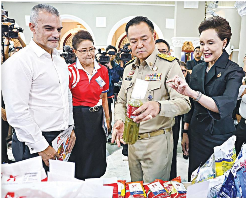
▲ กัดป้อม...นายอนุทิน ชาญวีรกูล นายกรัฐมนตรี เปิดโครงการไทยช่วยไทยลดภาระลดค่าครองชีพ ลดราคา สินค้ากว่า 3,000 รายการ สูงสุด 5% โดยมีนางสุภจี สุธรรมพันธุ์ รมว.พาณิชย์ ร่วมเยี่ยมชมบูธสินค้าด้วย

คาดโทษ □ ต่อจากหน้า 1 ไม่คือ ย้ำดูข้อกฎหมาย “คนละกริ่ง” ใช้ เติมน้ำมันได้หรือไม่ ลั่นแก้อัน รมต. ไม่ใช่ ที่ทดลองงาน รุกตั้งเคพีโอประเมินผลงาน ชี้หากงานไม่เข้าเป้า ขอทบทวนพิจารณา ปรับปรุง บอกถือเคล็ดตั้งกรม.35 ตำแหน่ง เผยรุ่งนี้นัด “เซน-หนิม” กินข้าวกลาง วันบนตึกไทยคู่ฟ้า หรือปมทำงานร่วมกัน ด้าน “สุภจี” เมินครม.มา จมมหาวิทยาลัย ห้องแถว ยันเรียนจริง-จบจริง คนมีความ สามารถจบเยอะ บอกไร้สาระมาก ส่วน “พริษฐ์” บอก “พรรคปชท.” สู้ยิบตา เตรียมข้อมูลคัดค้าน 10 ศต.หยุดปฏิบัติ หน้าที่หากศาลมีคำสั่งถอนอย่าเพิ่งด่วนสรุป ส่วนที่จะวางตัวให้เป็นหัวหน้าพรรคและ ผู้นำฝ่ายค้าน ยังไม่ได้มีการพูดคุยกัน ขณะที่ “ปิยบุตร” ลั่น 44 ศต. สัมไม่ผิดจริยธรรม เสนอแก้มาตรา 112 มองเป็นความกล้า-มี จริยธรรม กลับถูกนิตสังกรรม ประหาร