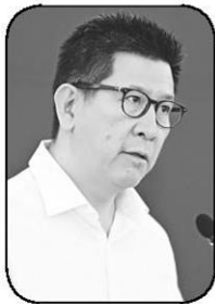
เอกนิติ นิติทัณฑ์ประภาศ

1 ธีมไลน์การเข้าบริหารประเทศของรัฐบาลอนุทิน 2 จะเกิดขึ้นอย่างเป็นทางการหลังการแถลงนโยบายต่อที่ประชุมร่วมรัฐสภาเสร็จสิ้นลง ซึ่งเดิมที่วางกันไว้ว่าจะแถลงช่วง 7-9 เม.ย. แต่ล่าสุดปรับเป็น 9-10 เม.ย. และจะมีการประชุม ครม.นัดแรกในวันที่ 10 เม.ย.ทันที ก่อนหยุดยาวสงกรานต์ ระยะเวลาเดียวกัน เรื่องการรับมือกับปัญหาสงคราม โดยเฉพาะเรื่องน้ำมัน ล่าสุดอนุทิน นายกรัฐมนตรี เรื่องกำหนดมาตรการเพื่อแก้ไขและป้องกันภาวะการขาดแคลนน้ำมันเชื้อเพลิงอันเนื่องมาจากความขัดแย้งในภูมิภาคตะวันออกกลาง โดยให้มี คณะกรรมการศึกษาความเหมาะสมในการกำหนดต้นทุนราคาน้ำมันเชื้อเพลิง (คตร.) โดยมีเอกนิติ นิติทัณฑ์ประภาศ รองนายกรัฐมนตรีและ รว.การคลัง เป็นประธาน และมีรัฐมนตรีว่าการกระทรวงพลังงาน