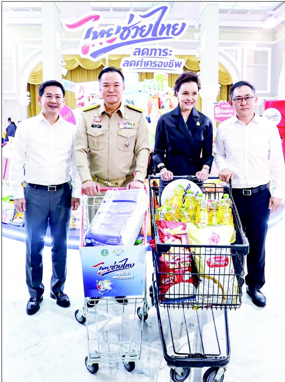
นายอนุทิน ชาญวีรกูล นายกรัฐมนตรี และ รวม.มหาดไทย เป็นประธานเปิดตัวโครงการ “ไทยช่วยไทย” ลดการ: ลดค่าครองชีพ โดยระหว่างเดินเยี่ยมมฐธสินค้าของโครงการได้อุดหนุนสินค้าหลายอย่างด้วย ที่ทำเนียบรัฐบาล