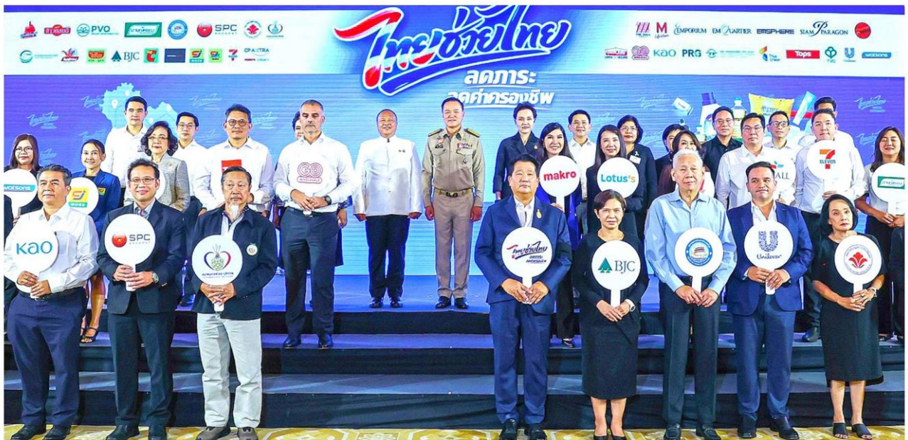
ดิคอปพ - นายอนุทิน ชาญวีรกูล นายกรัฐมนตรีและ รวม.มหาดไทย นางศุภจี สุธรรมพันธุ์ รองนายกรัฐมนตรีและ รวม.พาณิชย์ เปิดโครงการ "ไทยช่วยไทย" ผนึกกำลังห้างค้าส่งค้าปลีกสมัยใหม่ และผู้ผลิตรายใหญ่ของประเทศ นำสินค้าอุปโภคบริโภค 3,000 รายการ มาลดราคาสูงสุด 58% ที่ทำเนียบรัฐบาล เมื่อวันที่ 1 เมษายน

เมื่อวันที่ 1 เมษายน ที่ทำเนียบรัฐบาล นายอนุทิน ชาญวีรกูล นายกรัฐมนตรีและรัฐมนตรีว่าการกระทรวงมหาดไทย เปิดเผยภายหลังเป็นประธานในพิธีเปิดโครงการ ไทยช่วยไทย ลดภาระ ลดค่าครองชีพ ณ ดิ깅สันติโมเตริ์ ทำเนียบรัฐบาล ว่า รัฐบาลได้ตระหนักถึงความเดือดร้อนของพี่น้องประชาชนจากภาวะค่าครองชีพที่สูงขึ้นจากสถานการณ์ความผันผวนของราคาพลังงานในตลาดโลก จึงได้กำหนดนโยบายเร่งด่วนเพื่อ