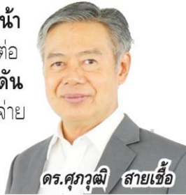
ดร.ศุภาวุฒิ สายเชื้อ

#จิตดี #ทันสมัย - "ดร.ศุภาวุฒิ สายเชื้อ" คาดเศรษฐกิจโลกปีหน้า ทำหายจีดีพีของไทยโต 2.9% แรงแหวนส่งออก-ท่องเที่ยวดีต่อ เนื่อง ส่วนครึ่งปีหลังหวังนโยบายการเงินหนุน "ลดดอกเบี้ย-ดันเงินเพื่อขึ้นระดับ 2%" KTC มุ่งทำการตลาดดันยอดใช้จ่าย เพิ่ม 10% จากปีนี้ บล.ทรีนี้ดี ซี ซี ตลท.ประกาศหุ้นเข้าออก รอบครึ่งปีแรก 2568 ลับตาहीं →→→ อ่านหน้า 8