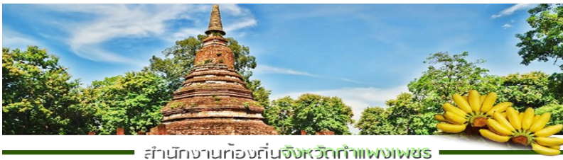
สำนักงานท้องถิ่นจังหวัดกำแพงเพชร